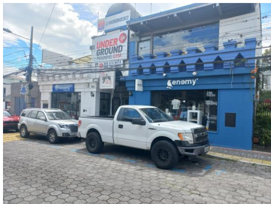
PROPIEDAD DE VARIOS LOCALES COMERCIALES