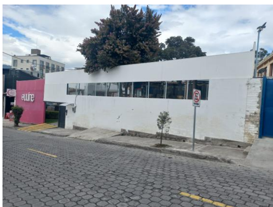
RESTAURANTE Y SALON DE EVENTOS UUINE