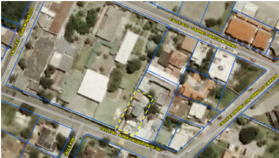
Imagen 1: Ubicación del inmueble