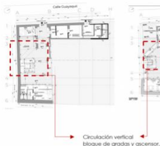
Imagen 3: Propuesta de nuevos elementos funcionales, Subsuelo.

PLANTA ALTA: circulaciones, sala de uso múltiple, baños, oficina de cronista, asistente y gestión administrativa, biblioteca, área de copiadora y certificación, laboratorio de digitalización, jefe de paleógrafo, catalogación e inventario, mediateca.