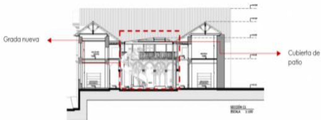
Imagen 1: Propuesta de elementos formales.

Estos elementos denotan su temporalidad constructiva tanto formal como materialmente, proponiendo el material de estructura metálica, la incorporación de estos elementos no modifica a las fachadas exteriores. Los mismos se indican en los gráficos a continuación: