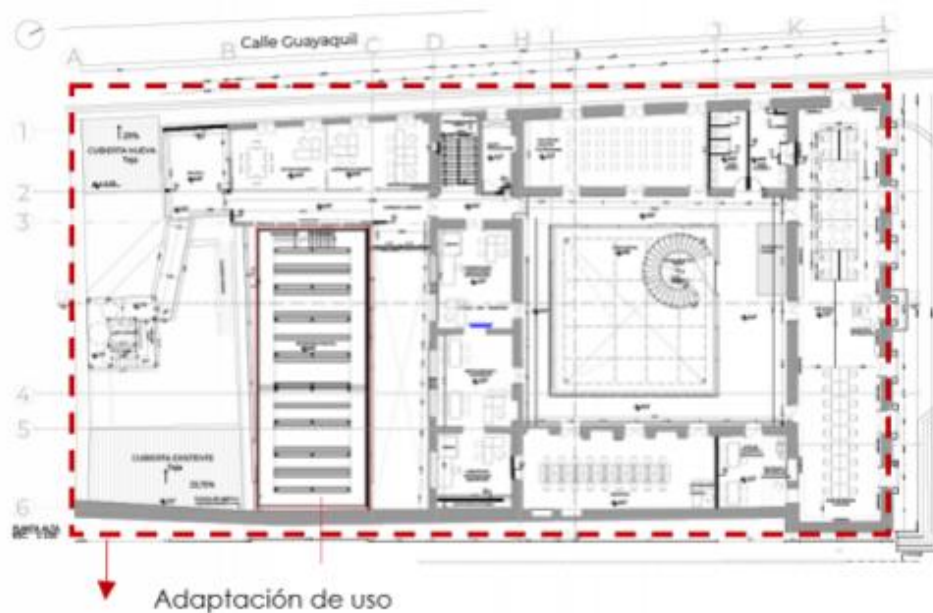
Imagen 5: Propuesta de elementos funcionales, PA