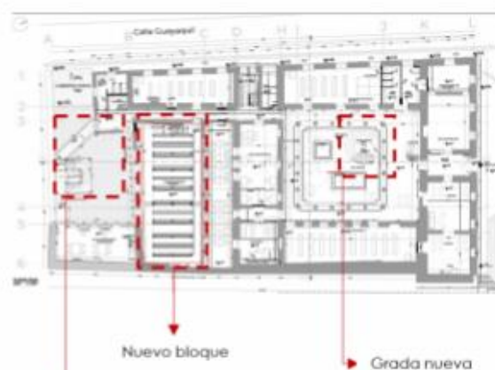
Imagen 4: Propuesta de elementos funcionales, PB