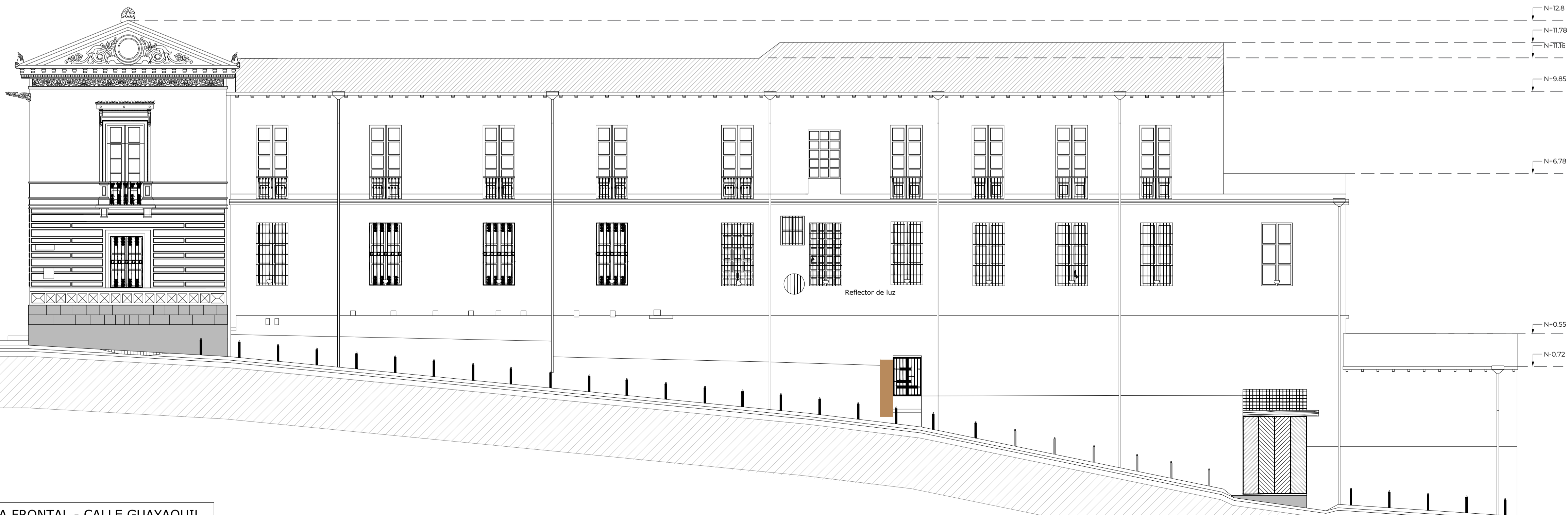
FACHADA FRONTAL - CALLE GUAYAQUIL ESCALA 1:100