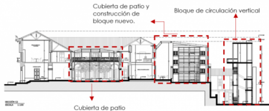
Imagen 2: Propuesta de elementos formales.

Los cambios en la distribución funcional se adaptan al nuevo uso, proponiendo la siguiente distribución: SUBSUELO 1: Taller de restauración, baños, circulaciones, seguridad, cuarto de equipos, cámara de transformación, cuarentena, taller de restauración y encuadernación,