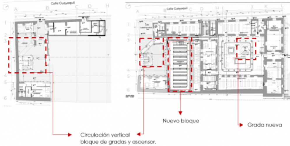
Imagen 3: Propuesta de nuevos elementos funcionales, Subsuelo.