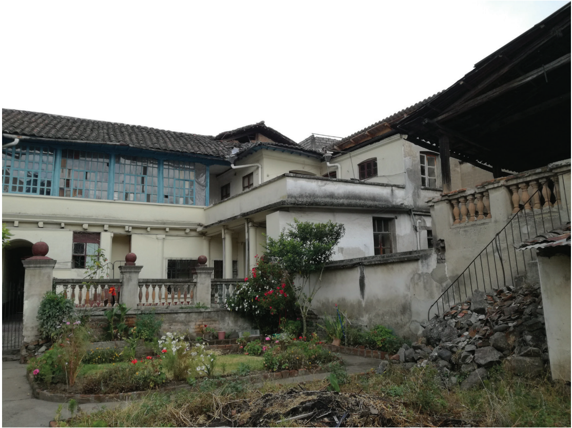
Estado Actual: Bloque A