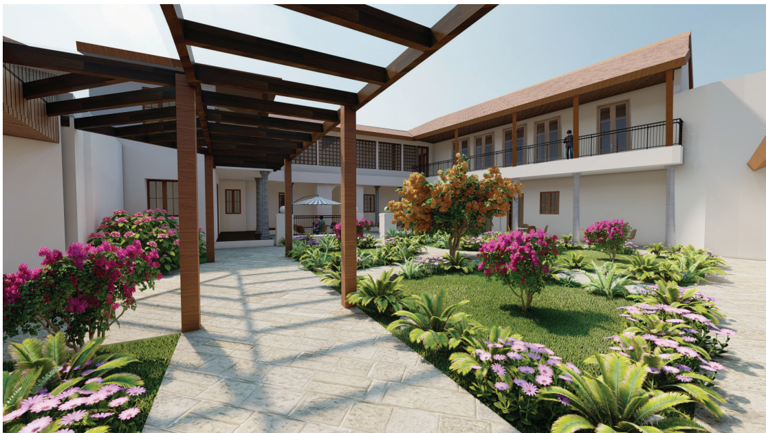
Propuesta: Bloque de oficinas