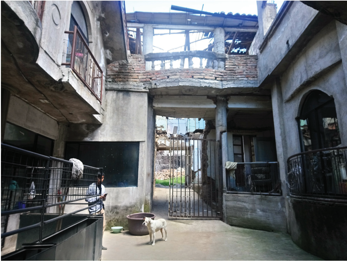
Estado Actual: Bloque B