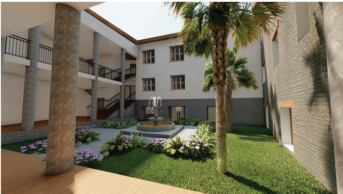
Propuesta: Locales comerciales, spa y gimnasio