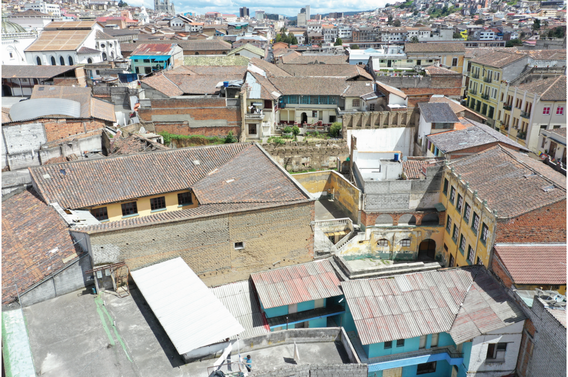
Estado Actual: Inmuebles inconexos y deteriorados