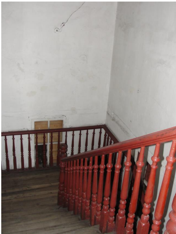
GRADA DE ACCESO ORIGINAL A SEGUNDA PLANTA.

Se manifiesta el hecho de que la escalera original se encuentra hacia el costado nororiental, está embebida entre muros y se encuentra en funcionamiento como elemento de acceso al nivel superior. La inclusión de una grada adicional como la de la fotografía anterior, demuestra una alteración a la tipología y la limitación o corte de la libre circulación perimetral completa por el cuerpo frontal.