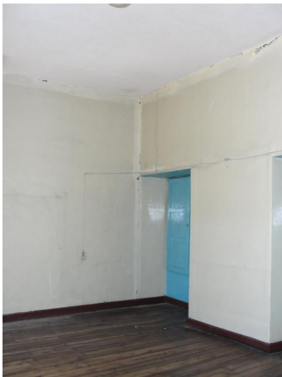
HABITACIONES DE LAS CRUJÍAS LATERALES Y POSTERIORES. SENCILLAS SIN NINGÚN ELEMENTO DECORATIVO DE INTERÉS.