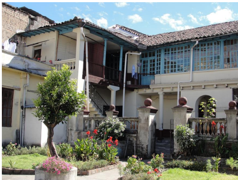
FACHADA POSTERIOR SUR OCCIDENTAL CON PROLONGACIÓN DE ELEMENTOS EDIFICADOS A LAS CRUJÍAS LATERALES ORIGINALES. REMATADOS CON TERRAZAS ACCESIBLES.