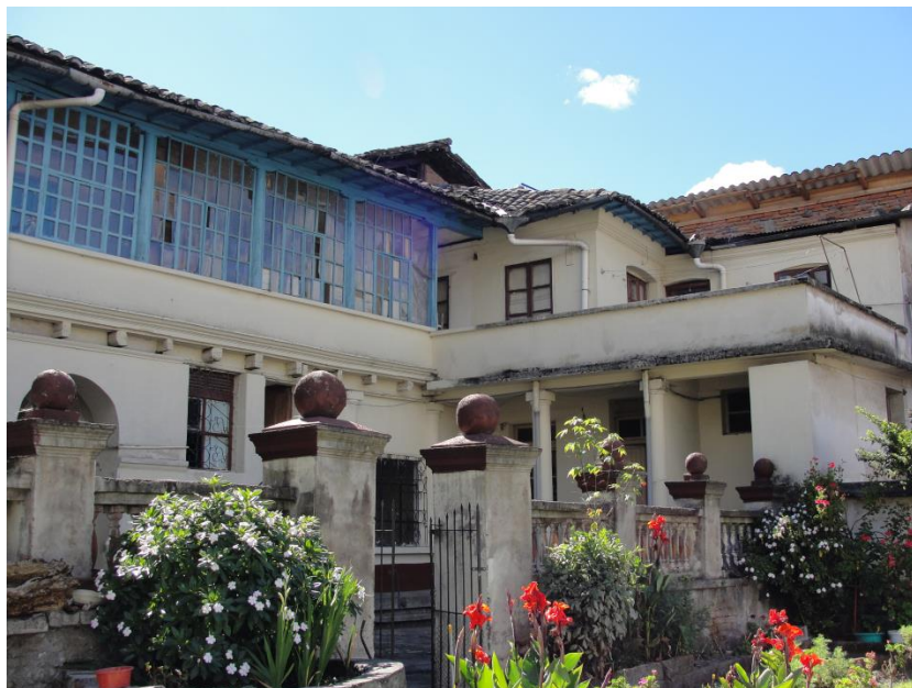
FACHADA POSTERIOR SUR ORIENTAL, PROLONGACIÓN DE ELEMENTOS EDIFICADOS A LAS CRUJÍAS ORIGINALES. REMATADO CON TERRAZA ACCESIBLE.