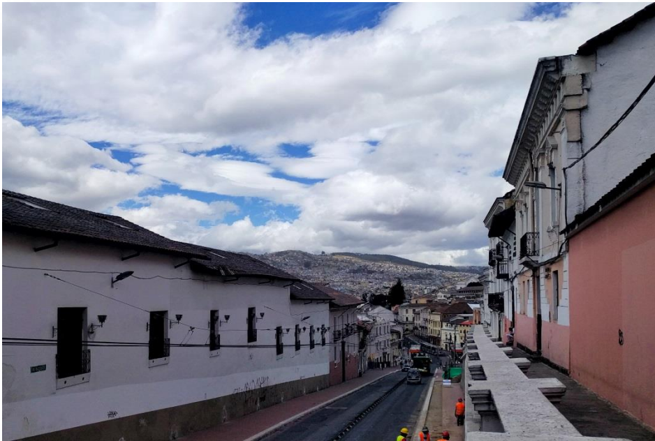
AV. MALDONADO, TRAMO DESCENDENTE NORTE SUR.