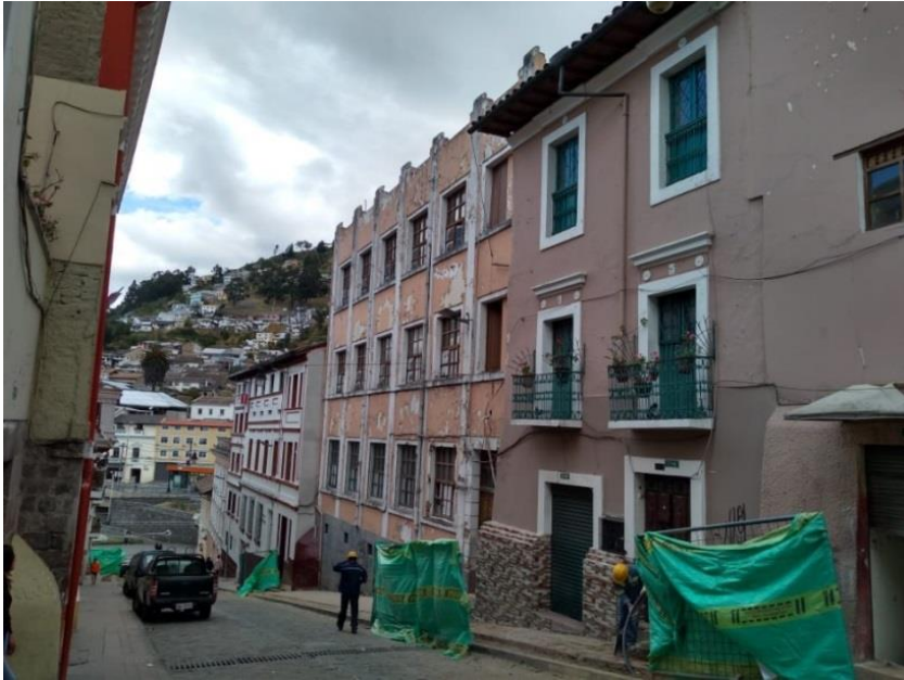
LECTURA DE TRAMO CALLE PAREDES, COSTADO SUR OCCIDENTAL.