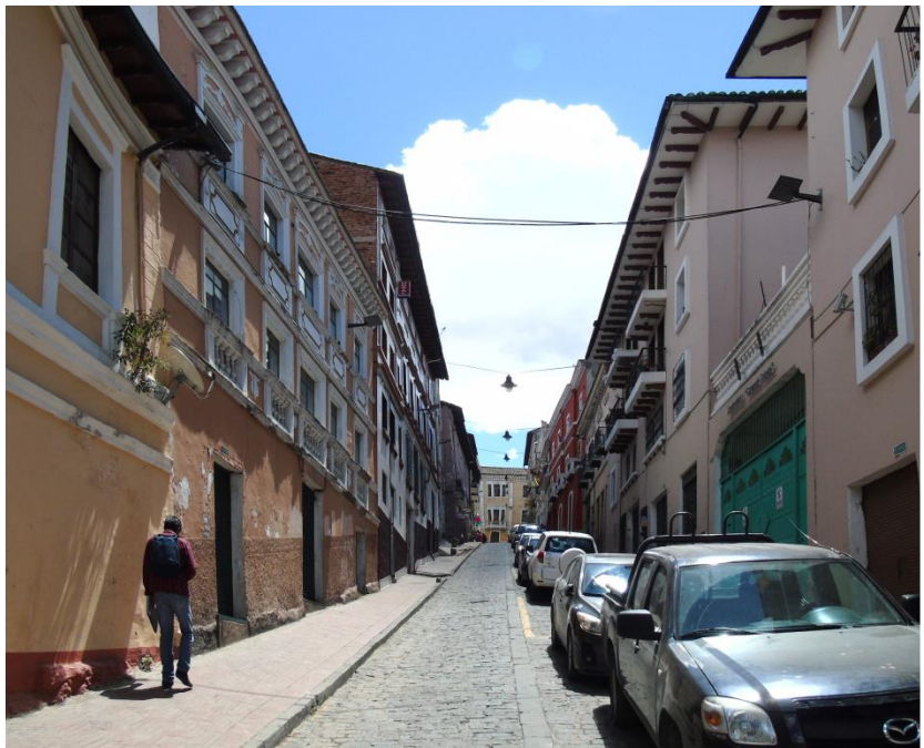
LECTURA DE TRAMO CALLE PAREDES, COSTADO SUR OCCIDENTAL Y NOR OCCIDENTAL.