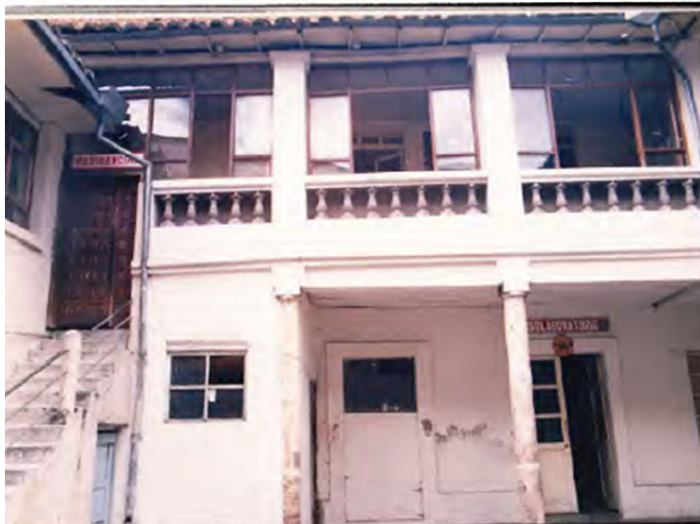
PATIO CENTRAL COMO CONSTA EN LA FICHA DE INVENTARIO DE 1990.