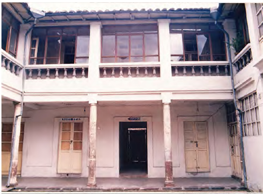
PATIO CENTRAL COMO CONSTA EN LA FICHA DE INVENTARIO DE 1990.

Esta es una construcción de estilo ecléctico, de arquitectura vernácula tradicional que data de las primeras décadas del siglo pasado. Edificación original de dos cuerpos sobre la rasante de terreno conformada por cuatro vanos alineados en las dos plantas, un zaguán central desplazado hacia la derecha que determina un eje que da acceso a un patio central. El patio estuvo circundado por cuatro crujías desarrolladas en dos plantas, su tipología fue definida por corredores con columnatas de piedra de cuatro columnas por lado que sustentaban un corredor en el piso superior y generaban corredores de circulación perimetral. Originalmente constituida por muros portantes de adobe que sustentaban la edificación, entresijos de madera y cubiertas de estructura conformada por maderámenes y un recubrimiento de teja de barro cocido.