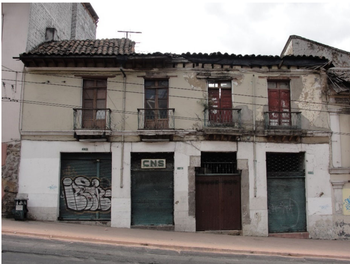
FACHADA FRONTAL. AVANZADO ESTADO DE ABANDONO Y DETERIORO.