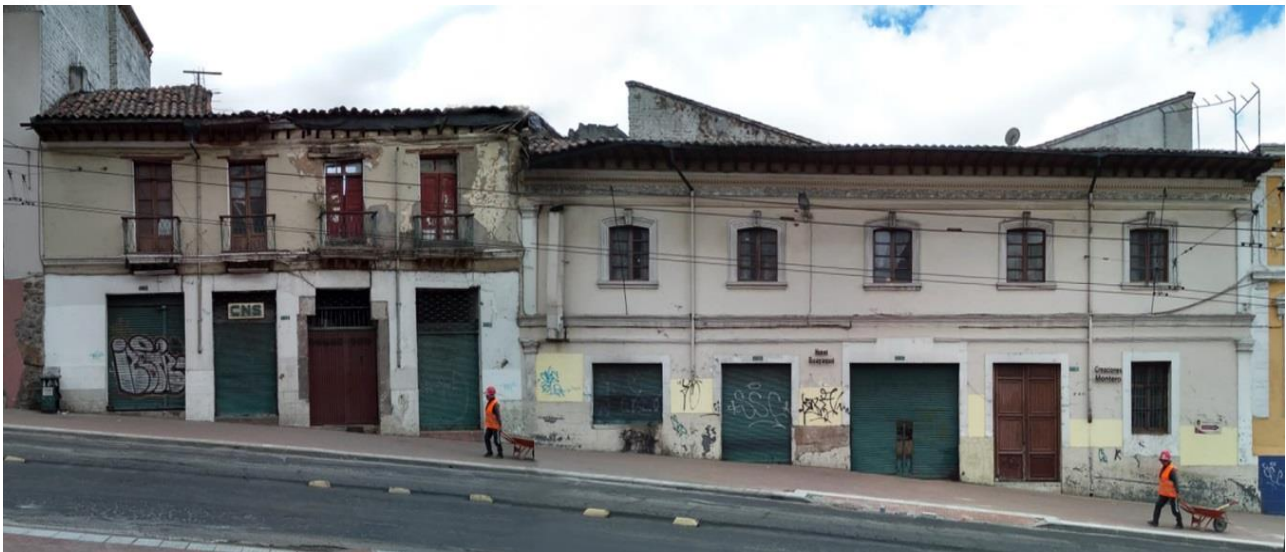
EDIFICACIONES SOBRE LA AV. MALDONADO, SUJETOS DE POSTERIOR ANÁLISIS.