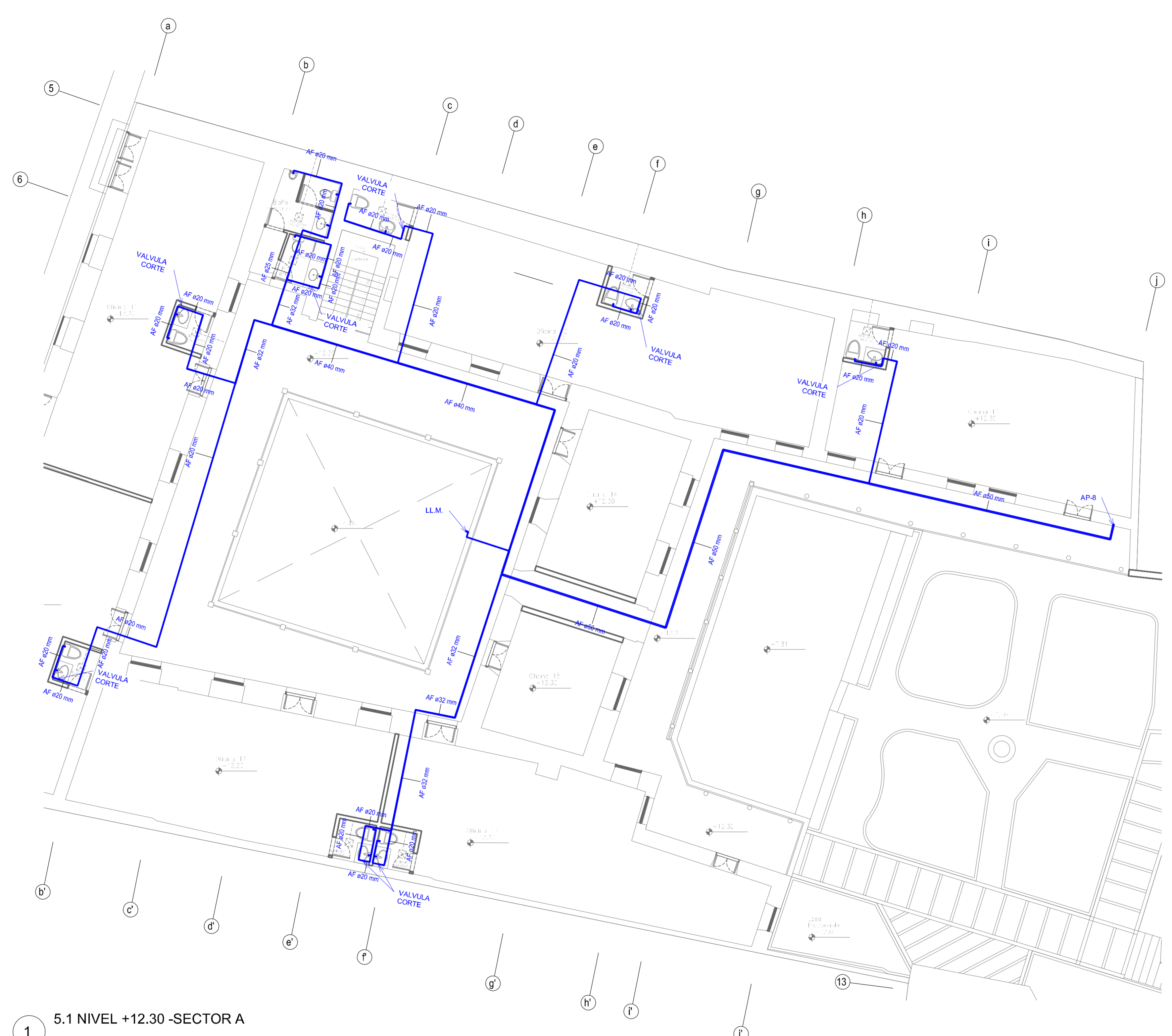
1 5.1 NIVEL +12.30 -SECTOR A 1:100