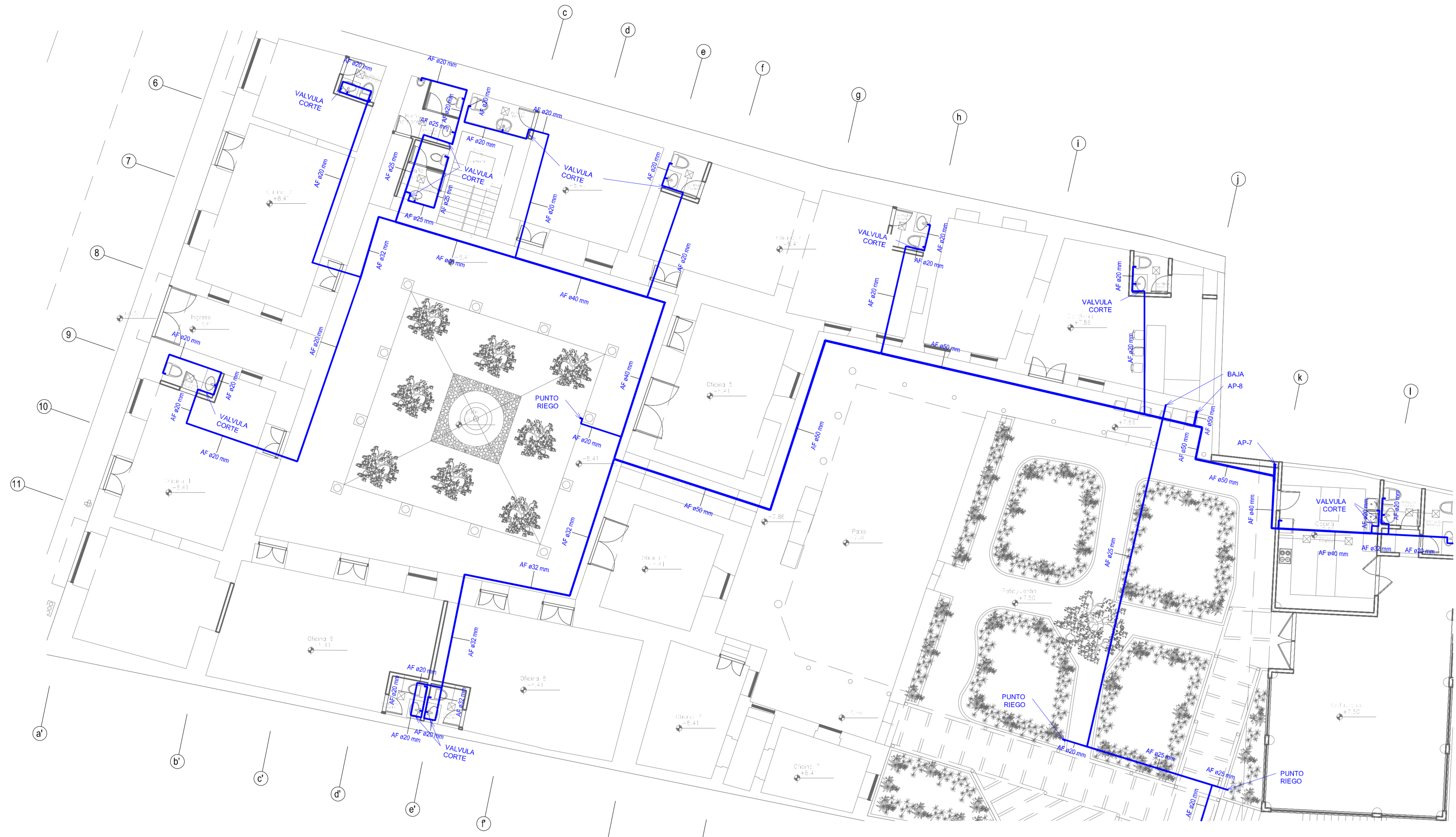
1 4.1 NIVEL +7.50 - SECTOR A 1:100