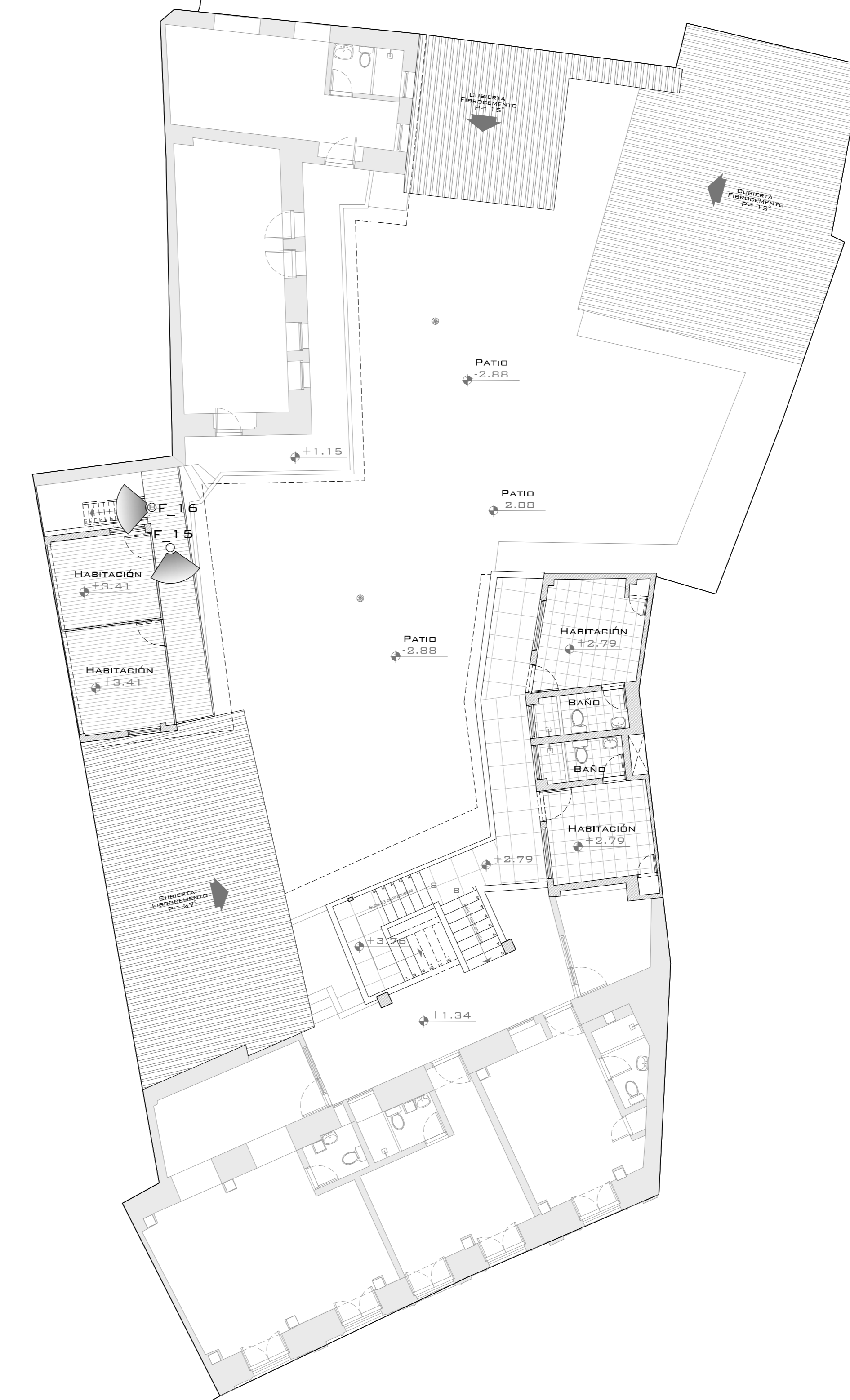
BLOQUE D MEMORIA FOTOGRAFICA NIVEL +2.79 ESC: 1 _____ 100 0 1 2 3 4 5 6