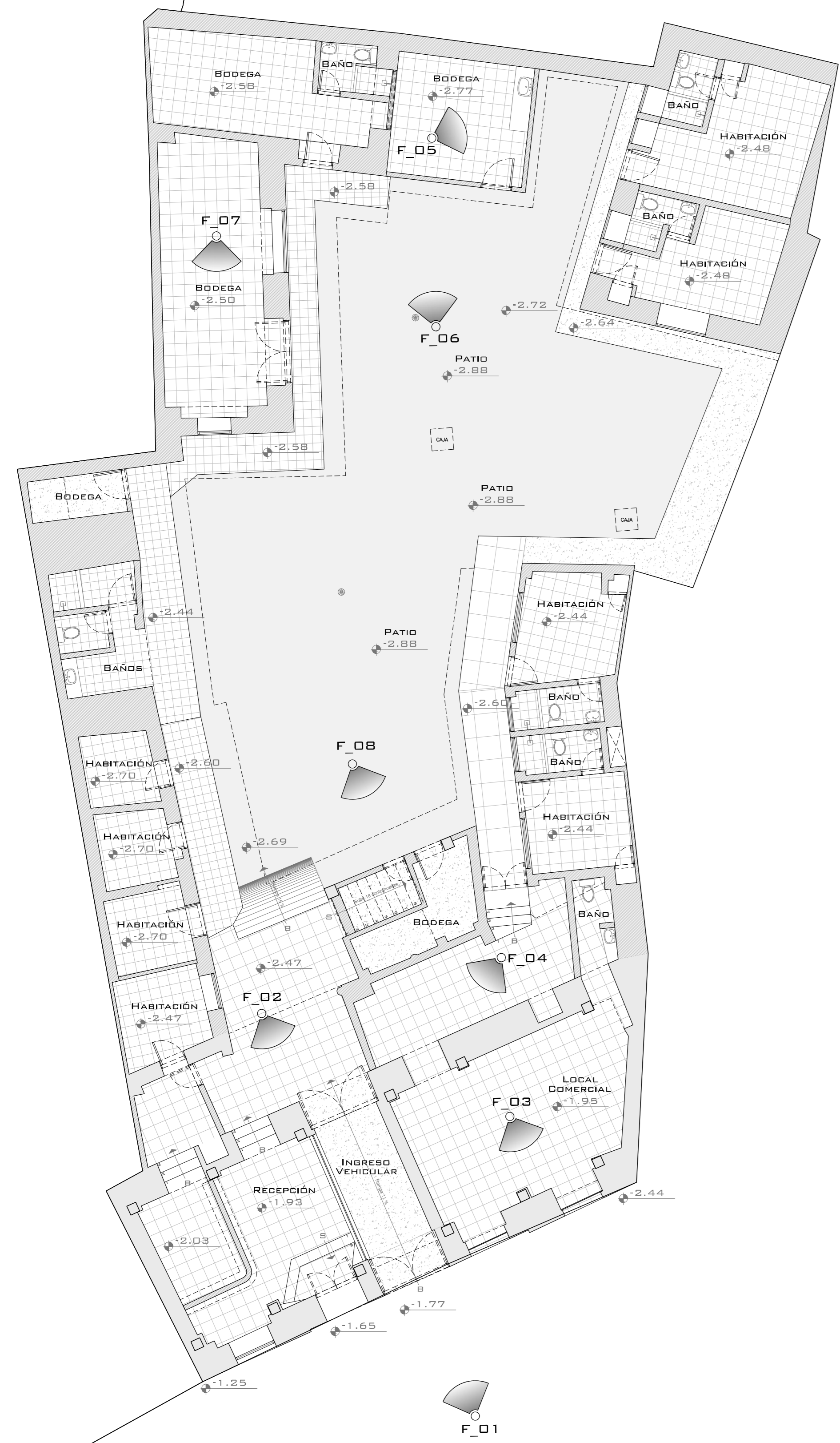
BLOQUE D MEMORIA FOTOGRAFICA NIVEL -2.88 ESC: 1 _____ 100 0 1 2 3 4 5 6