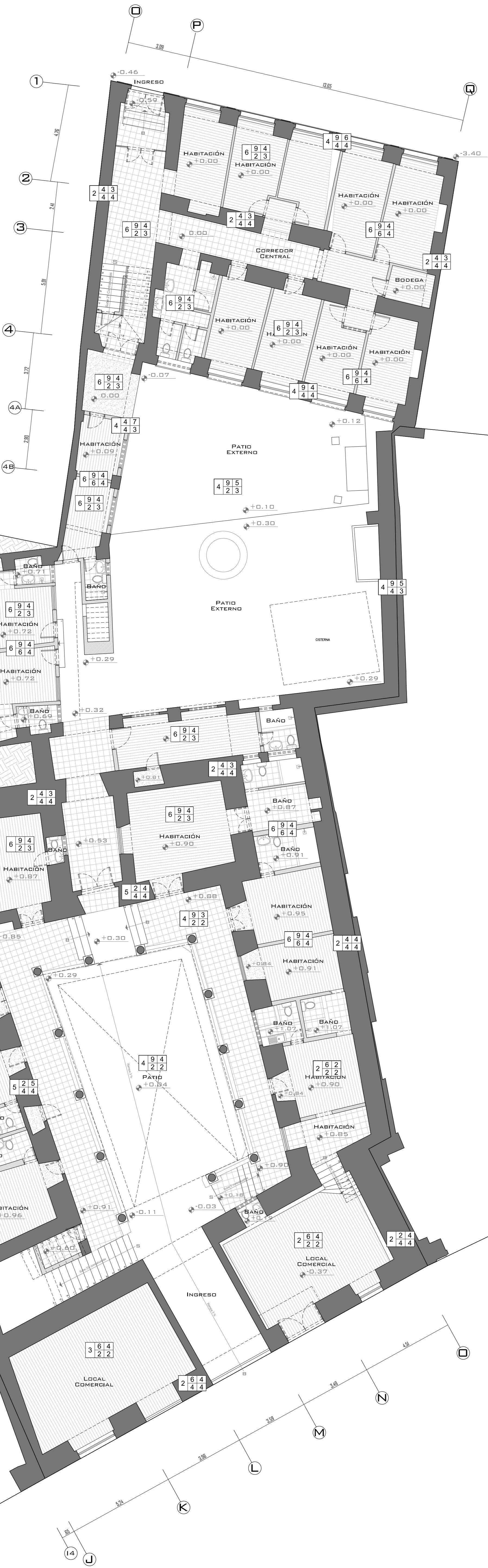
BLOQUE C PLANTA PATOLOGÍAS NIVEL +0.00 ESC: 1 _____ 100 0 1 2 3 4 5 6