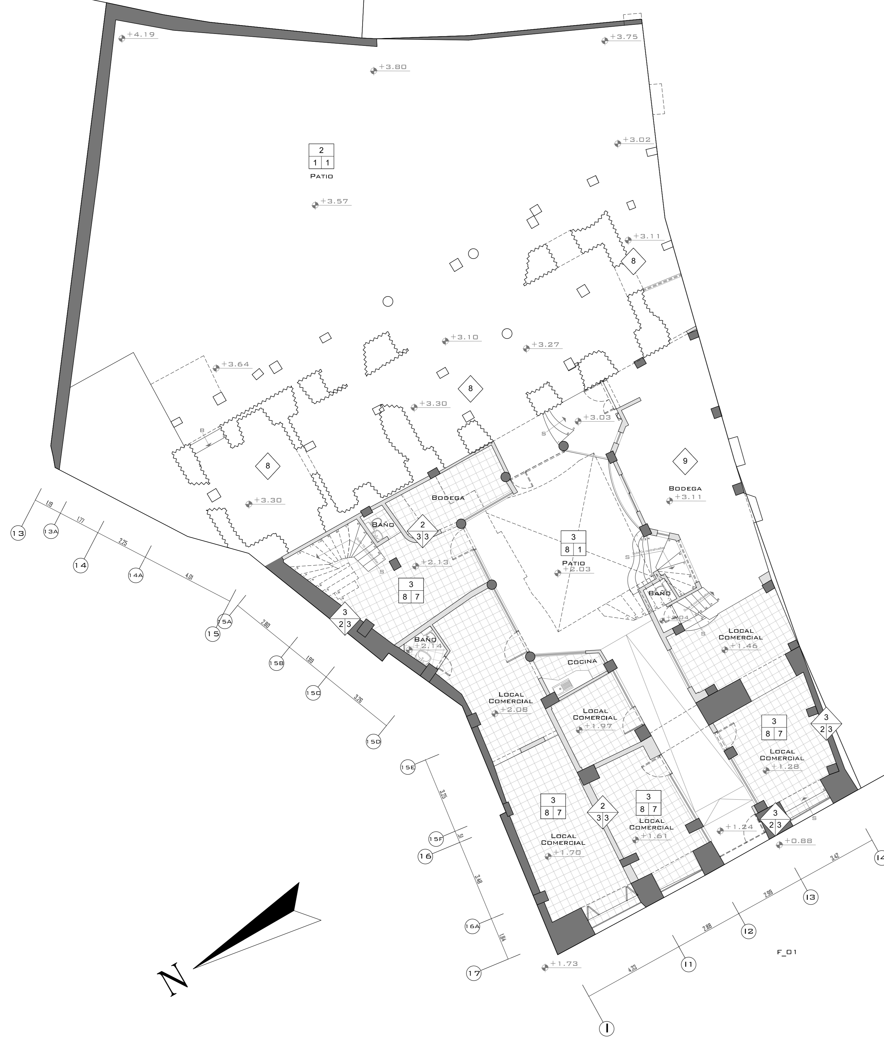
BLOQUE B PLANTA MATERIALES CONSTRUCTIVOS NIVEL +2.03/+3.30 ESC: 1 _____ 100 0 1 2 3 4 5 6