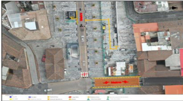
Imagen: 1. Propuesta de intervención, Boulevard 24 de Mayo.