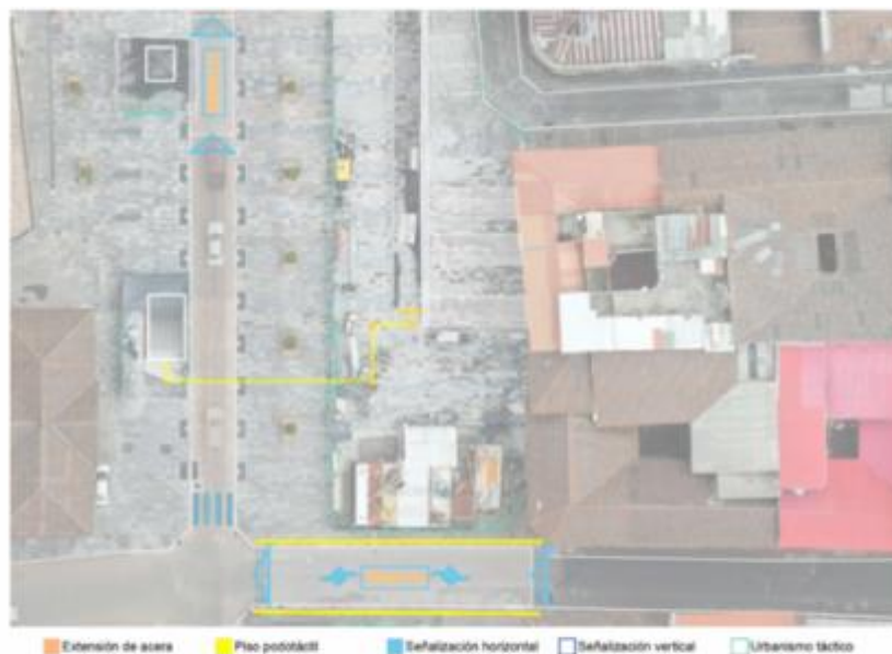
Imagen: 10. Sección de calle Benalcázar, Boulevard 24 de Mayo.