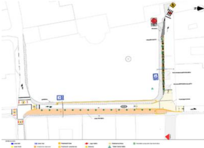
Imagen: 2. Propuesta de intervención, Plaza de San Francisco.