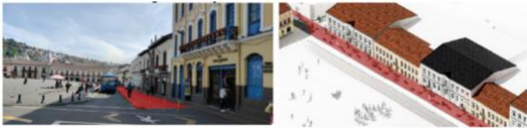
Imagen: 5. Sección de calle Benalcázar pacificada, Plaza de San Francisco.

1. Implementación de una plataforma única (extensión de la acera) en el tramo de la calle Benalcázar entre la calle Sucre y Bolívar.