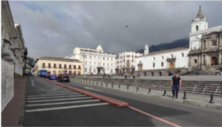
Imagen: 3. Sección de calle Benalcázar pacificada, Fuente: Memoria Técnica, IMPU, 2022.

ocasionado el deterioro de la imagen urbana, con graffitis en muros, robo de rejillas, rotura de bolardos, daños en iluminación, ocasionando que el espacio público se vea degradado.