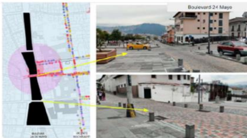
Imagen: 4. Estado Actual, Boulevard AV 24 de Mayo-Plaza de San Francisco.