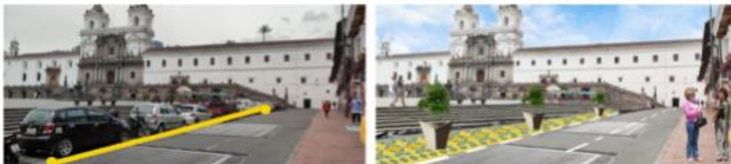
Imagen: 6. Propuesta de intervención sobre la calle Sucre entre Benalcázar y Cuenca.

2. Se utilizará como estrategia el urbanismo táctico para mejorar las condiciones de caminabilidad incrementando la sección de acera en el carril sur de la calle Sucre, entre las calles Benalcázar y Cuenca, con pintura, bolardos plásticos y maseteros temporales.