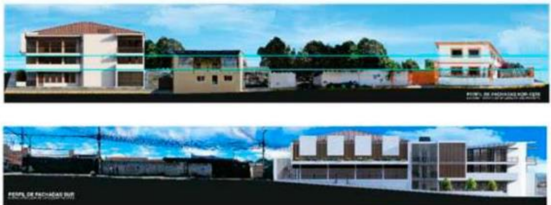
Imagen 2: Inserción de la fachada al contexto

Conforme se puede observar en las siguientes imágenes, la integración de la nueva edificación, está implantado en un entorno con construcciones eclécticas, por lo que, su composición se regirá al entorno en cuanto a las líneas de entpiso, líneas de dintel y base de vanos, ya que, esta nueva edificación, contribuye a un nuevo aporte de la arquitectura de integración con su entorno.