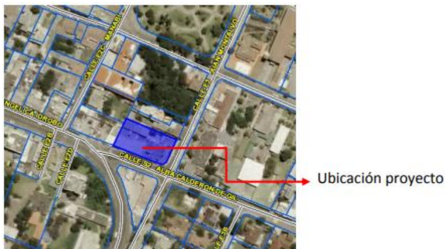
Imagen 1. Forma de manzana.

La implantación del proyecto se encuentra en un lote de terreno esquinero, emplazado en las calles Alba Calderón de Gil y Juan Montalvo, cuya morfología de su entorno está compuesto, por lotes de forma regular, adaptados a la topografía del lugar, como se muestra a continuación: