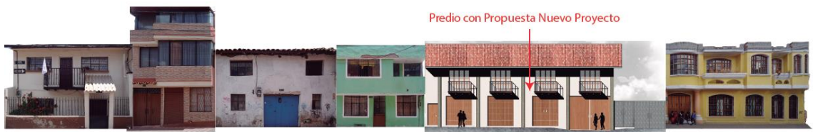
Fachadas Calle Quito Propuesta Nuevo Proyecto