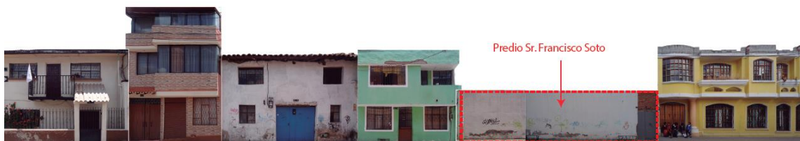
FACHADA DEL PREDIO BALDÍO Y ENTORNO (fotografía tomada de la memoria fotográfica presentada)

La propuesta ingresada corresponde a un proyecto de obra nueva, en el predio 3518092, el cual es un lote baldío, consiste en una edificación de dos pisos con dos accesos peatonales y uno vehicular. Se acoplará a la morfología del entorno, ya que se utilizará cubiertas inclinadas las cuales serán de madera recubiertas de teja de barro cocido, se utilizará mamposterías de ladrillo y balcones. En la parte posterior se ubican las gradas, al igual que los parqueaderos y un patio posterior comunal.