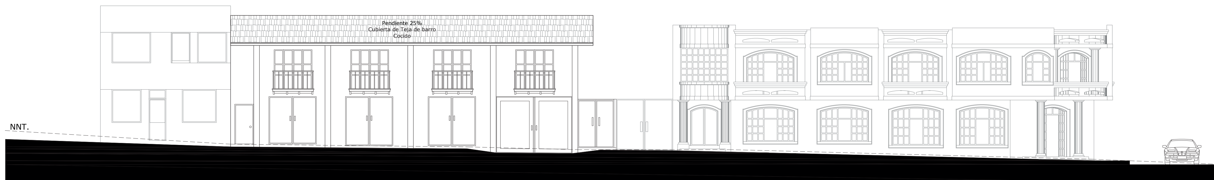
Fachada Frontal Escala 1:100