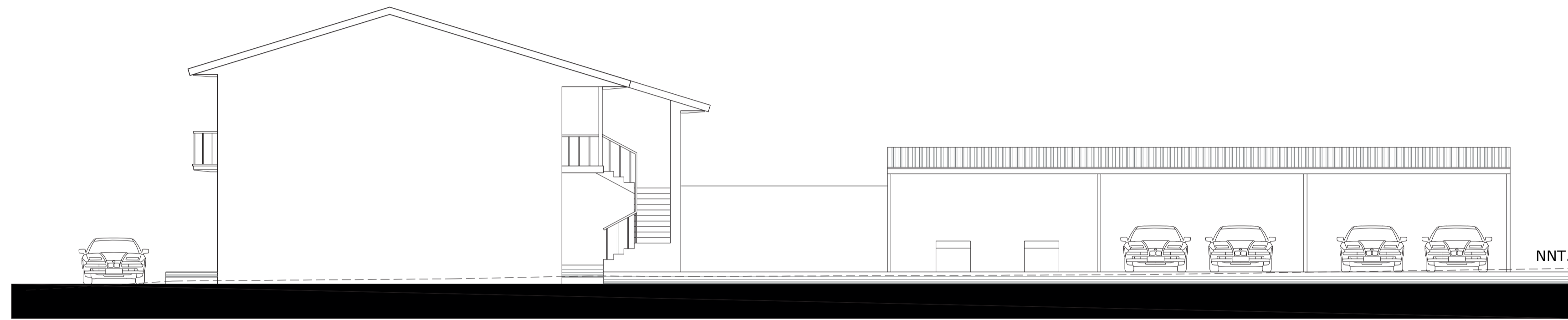
Fachada Lateral Derecha Escala 1:100