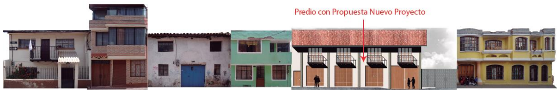
Fachadas Calle Quito Propuesta Nuevo Proyecto

De acuerdo al cuadro de áreas presentado (Lámina N° 01/03)