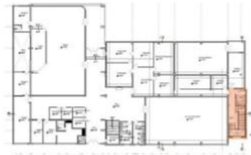
AREA DE INTERVENCIÓN

Mantiene las alturas de acuerdo al a normativas vigente.