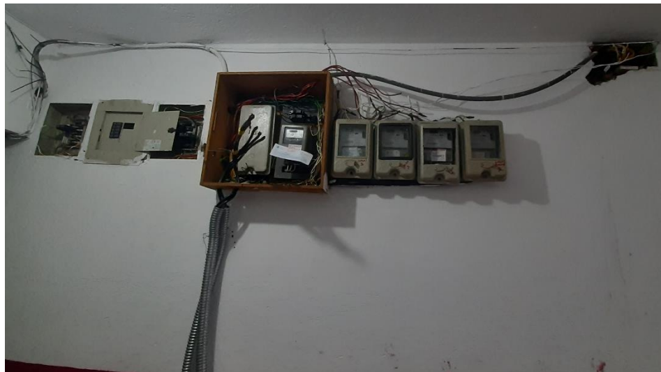
Fotografía 3. Instalaciones eléctricas.

Por otra parte, el sistema de instalación eléctrica es muy deficiente ya que, el cableado tanto de la red principal como de las acometidas se encuentra a la interperie.