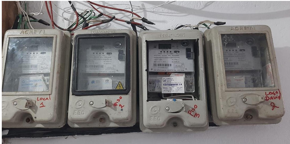
Fotografía 2. Medidores eléctricos activos.

El sistema eléctrico de la propiedad cuenta con cuatro medidores eléctricos activos, de los cuales, 3 pertenecen al sistema general por piso y 1 para el centro comercial existente en la edificación.