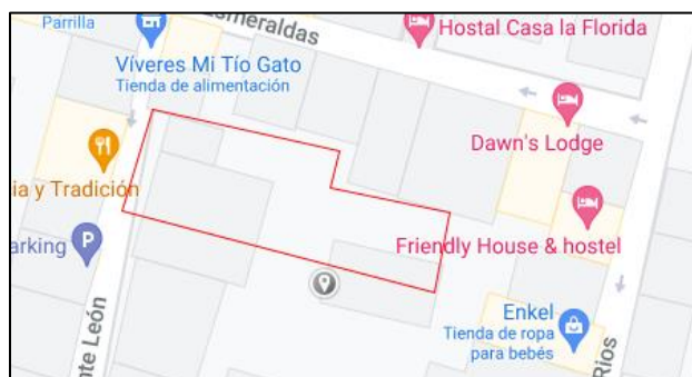
Figura 1. Ubicación de la edificación.