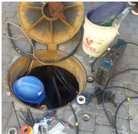
Fotografía 1. Soterramiento eléctrico.