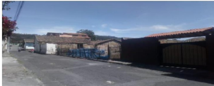
FACHADA FRONTAL DEL PREDIO