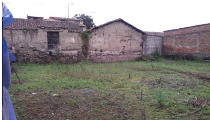
VISTA INTERIOR DEL PREDIO