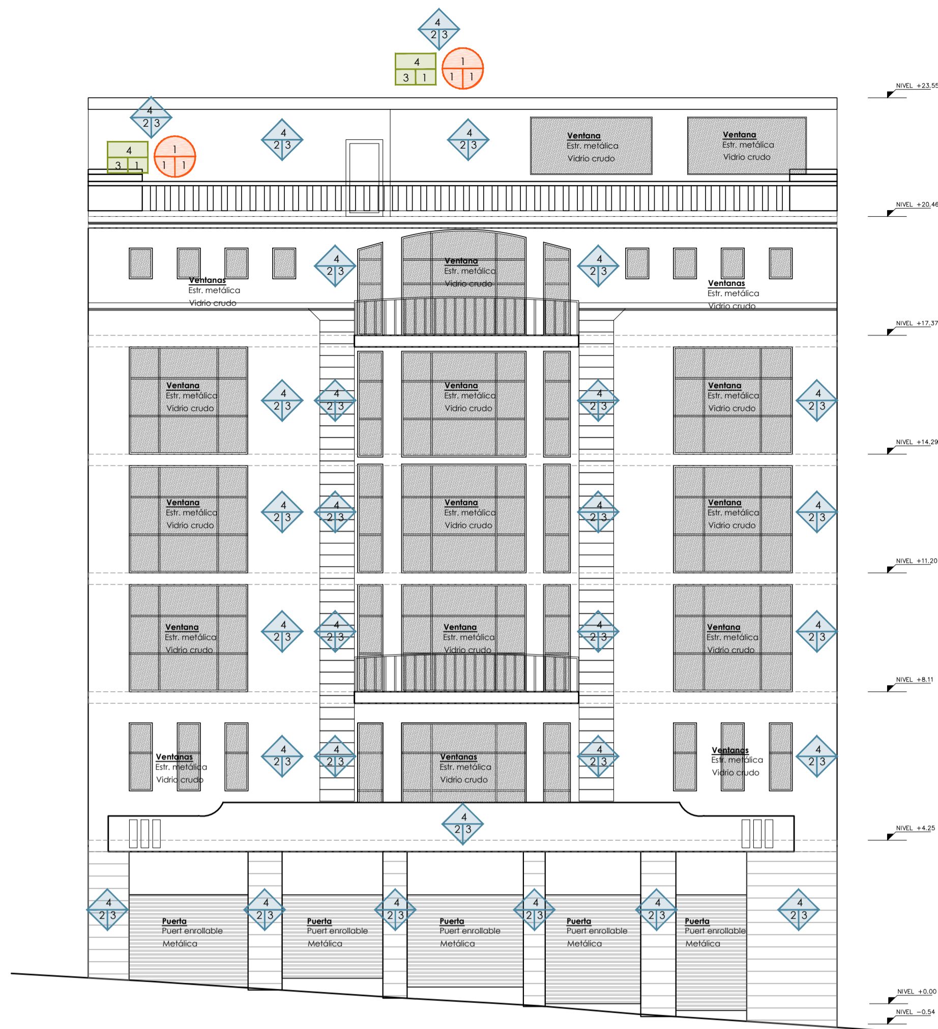
FACHADA ESCALA 1/125