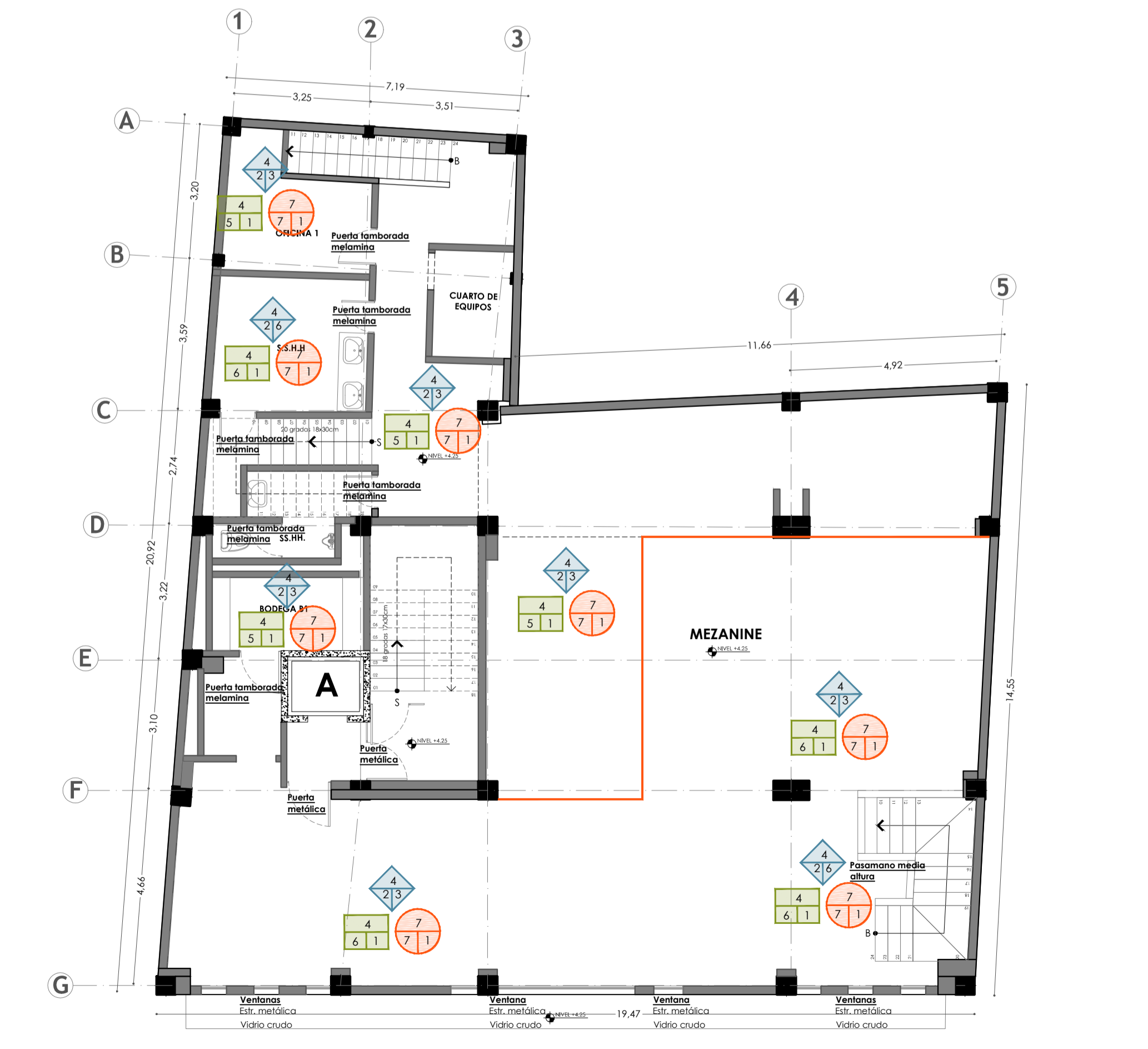
PLANTA PISO 1 ESCALA 1/125 ESTADO ACTUAL