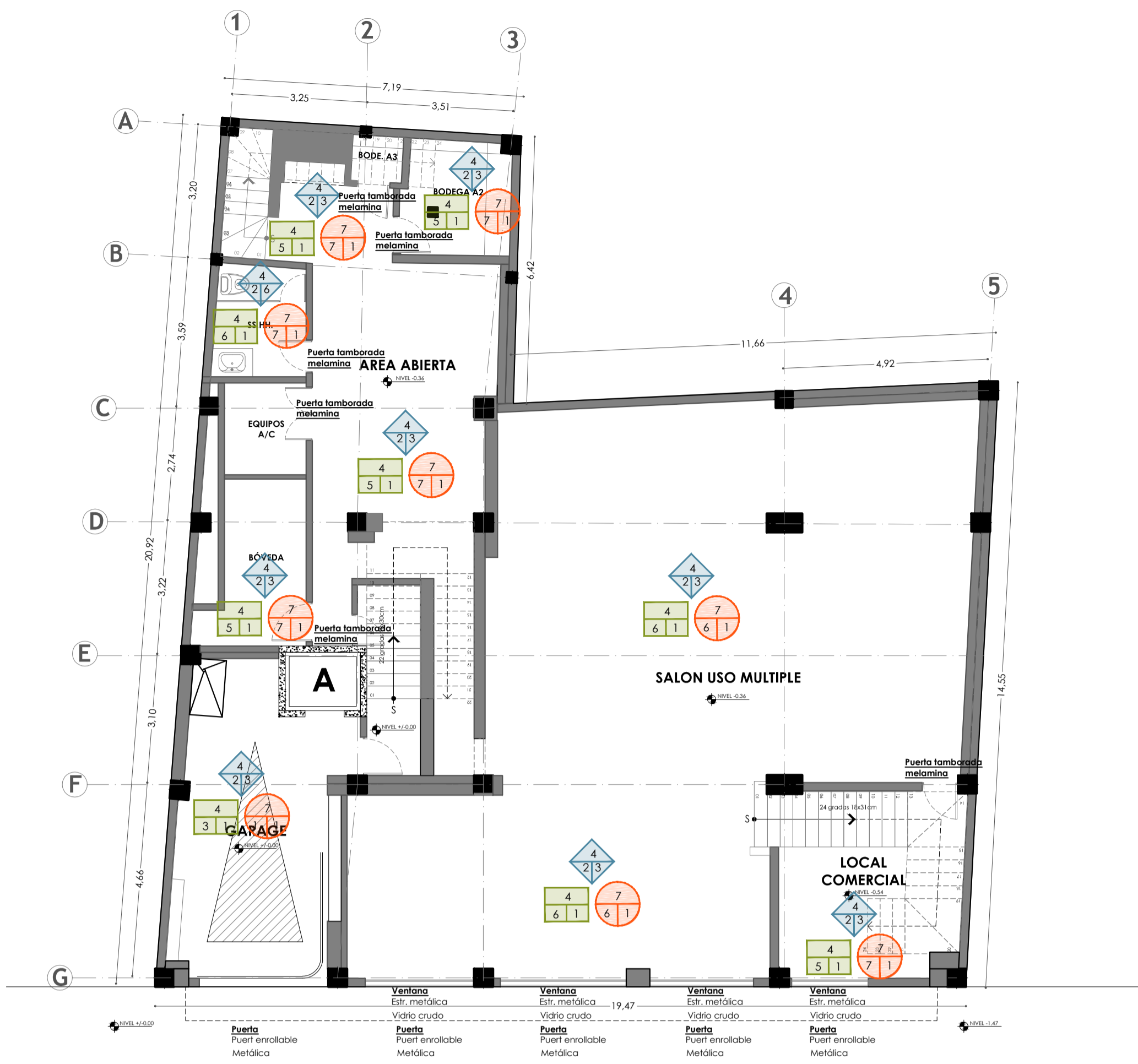
PLANTA BAJA ESCALA 1/125 ESTADO ACTUAL