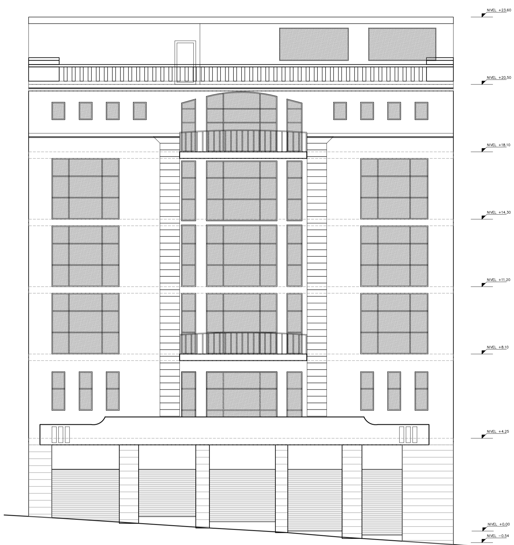
FACHADA FRONTAL ESC 1:100