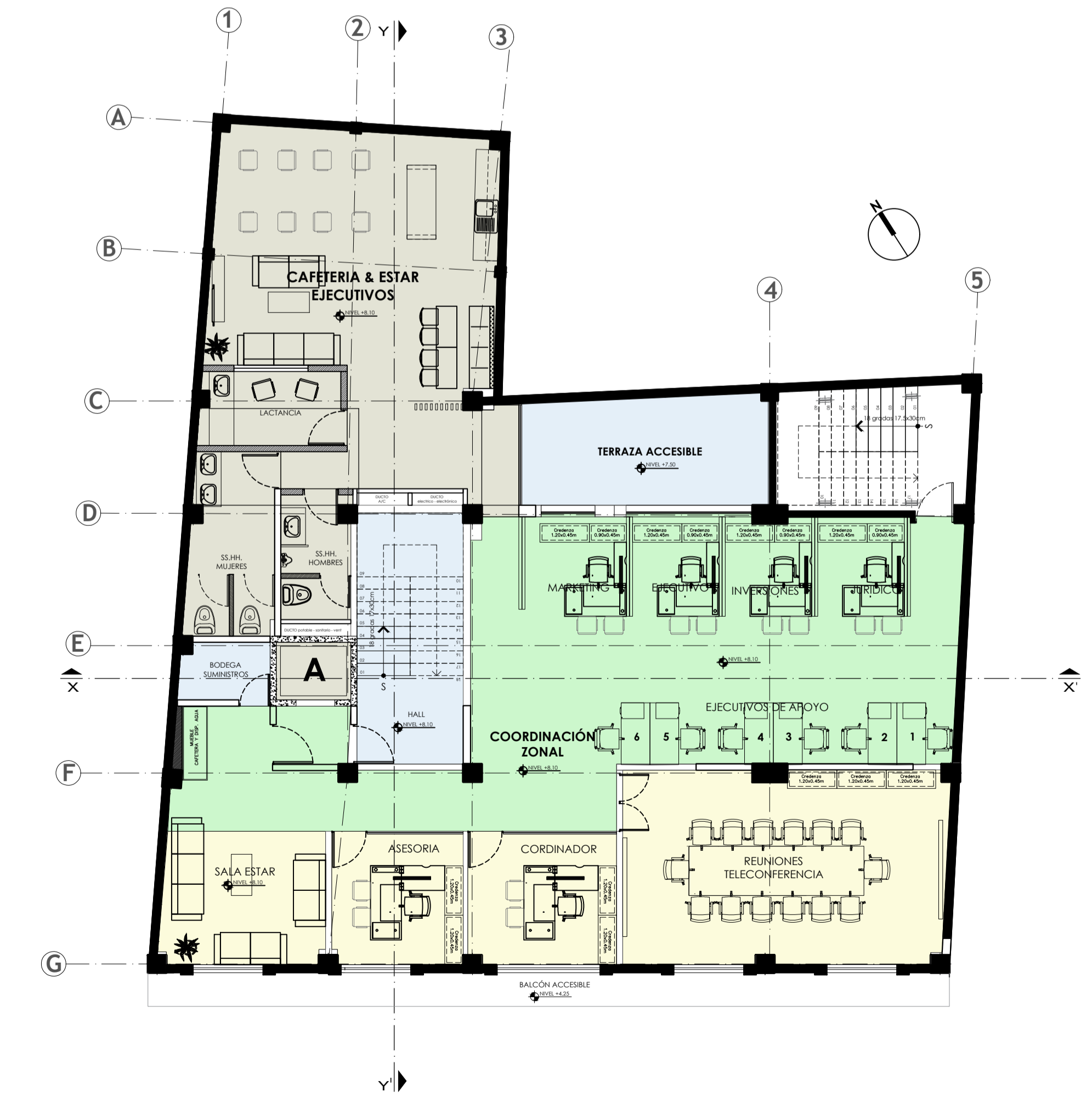
PLANTA PISO 2 NIVEL +8.10 ESC: 1:100