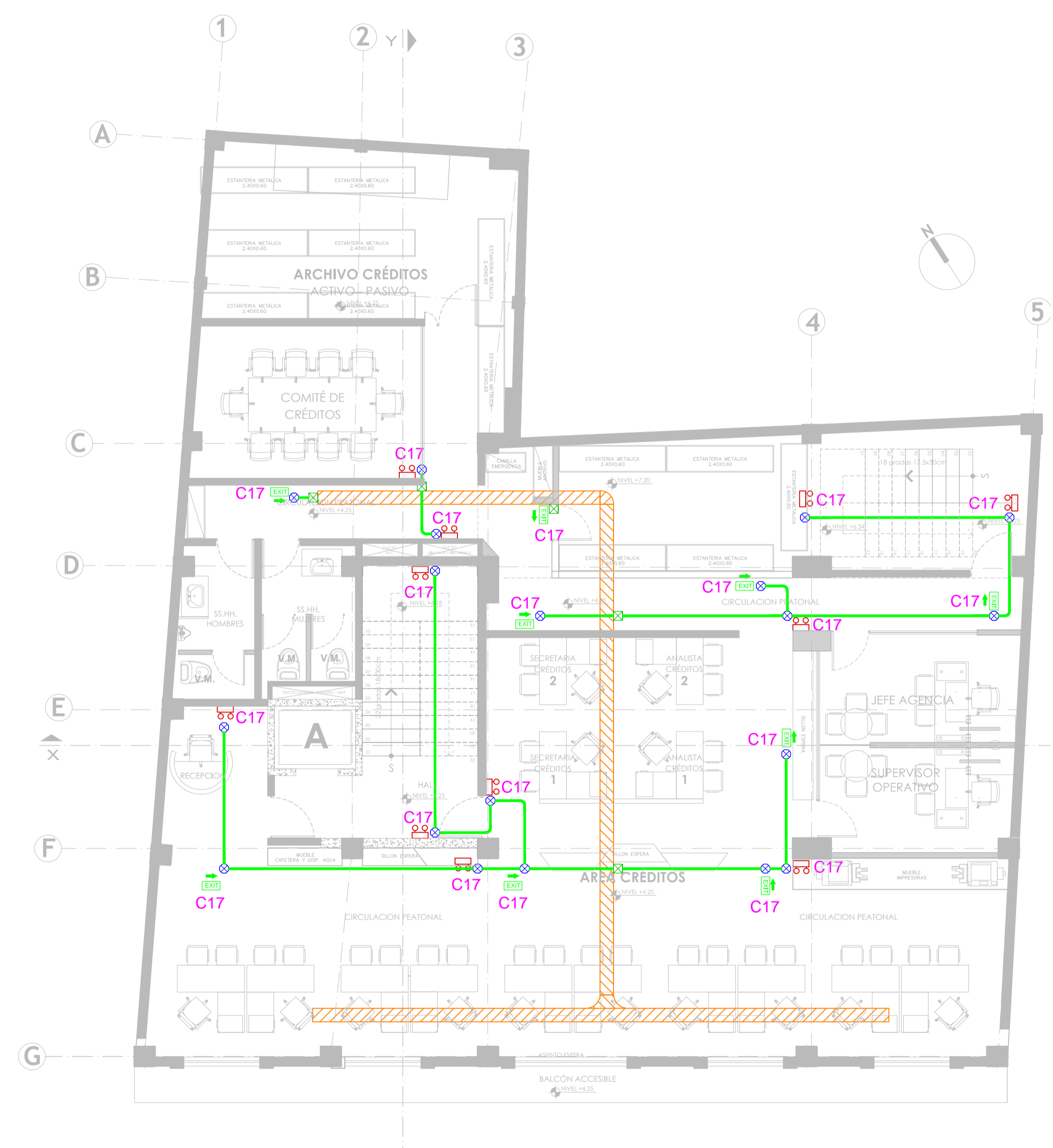
PLANTA PISO 1 NIVEL +4.25 ESC: 1:100