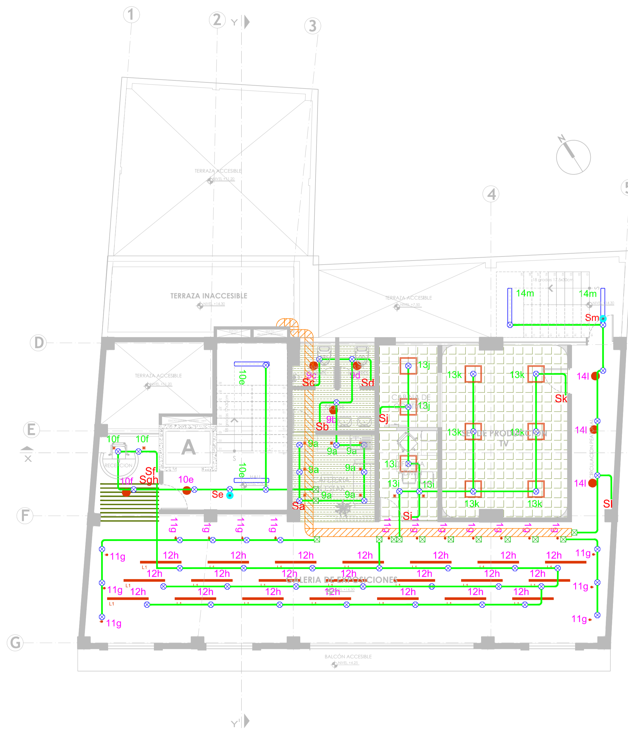
PLANTA PISO 4 NIVEL +14.30 ESC 1:100