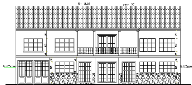
FACHADA FRONTAL PROPUESTA