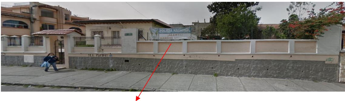
CONSTRUCCIÓN A SER SUSTITUIDA

La propuesta ingresada corresponde a un proyecto definitivo de obra nueva denominado “Edificio Albán Barrera.”, mismo que está ubicado en la parroquia de Conocoto, Se propone sustituir la construcción existente por otra que se implantará tomando en cuenta aspectos con relación al lugar, y a las construcciones dominantes.