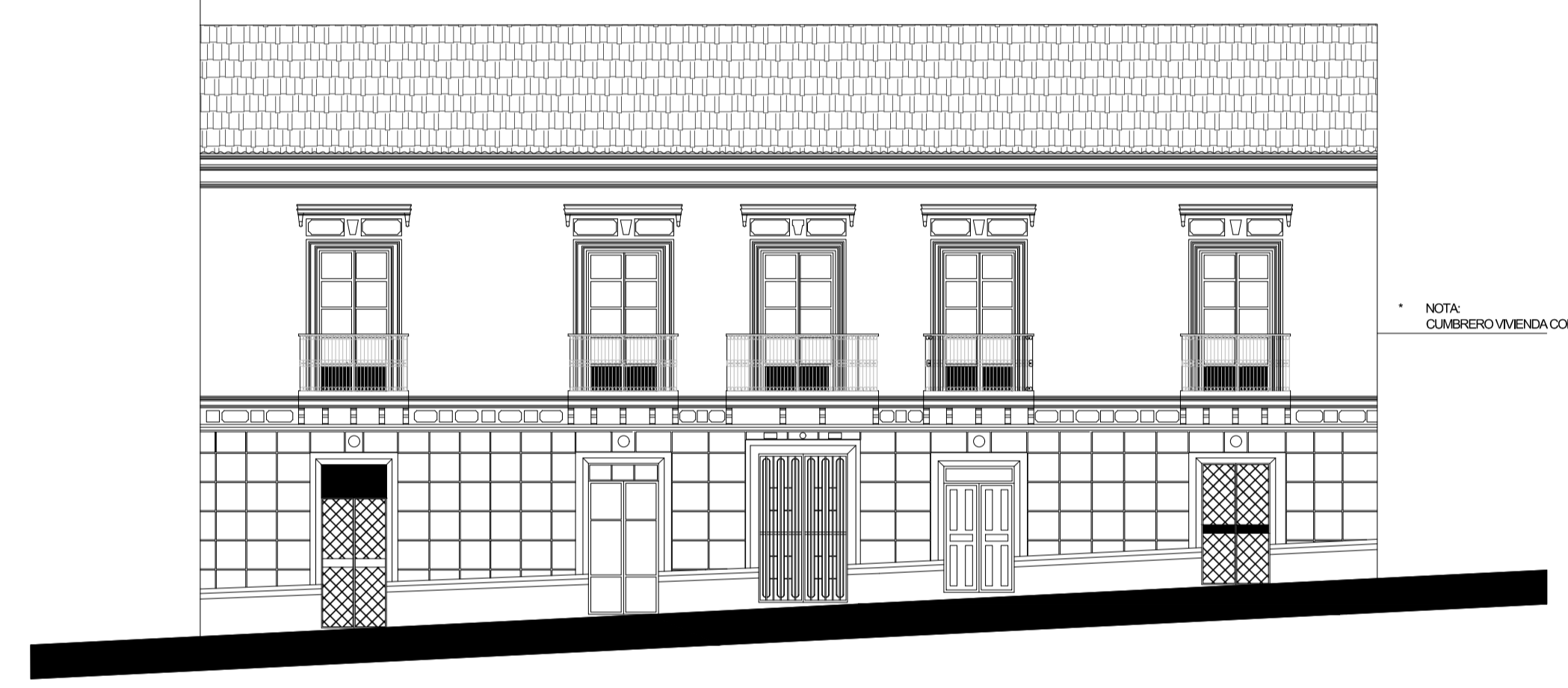
FACHADA A CALLE VICENTE LEÓN