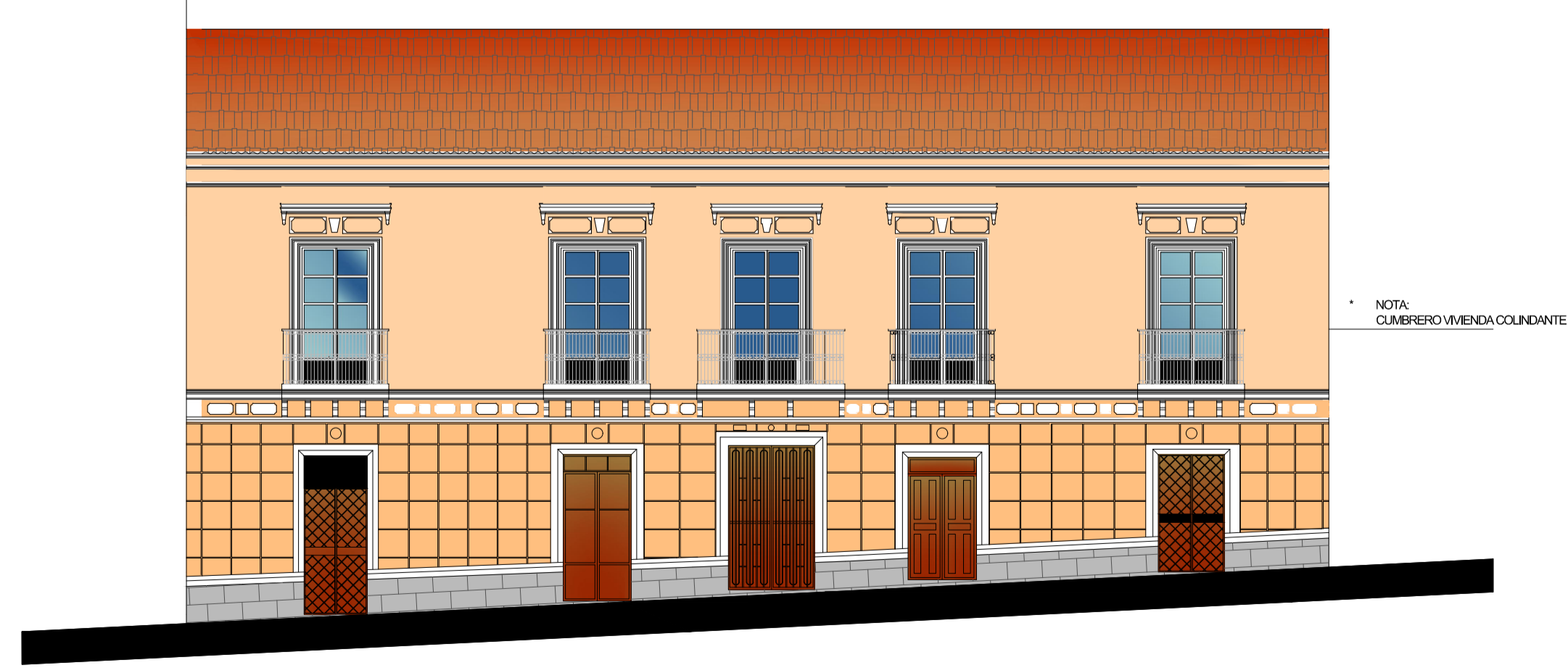
FACHADA - COLOR ACTUAL