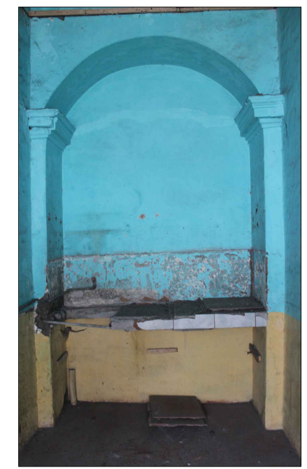
1 Planta alta, cierre añadido de bloque, mesón y cerámicos añadidos