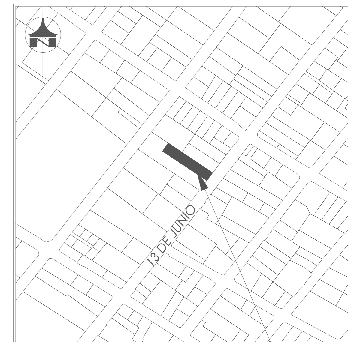
UBICACION LOTE ESCALA: 1:2500