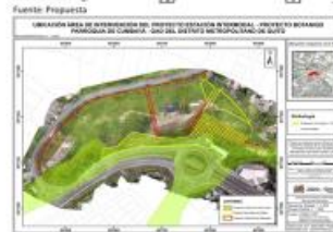
Figura 2: Plano de implementación del proyecto Estación de Transferencia Cumbayá y perfil del proyecto

Dr. Santiago Guarderas Izquierdo, Alcalde del Distrito Metropolitano de Quito: Gracias a usted. Quiero indicarle que si no me equivoco yo ya pedí el examen especial a la Contraloría General del Estado, si no se lo ha hecho todavía estaría dispuesto a que el procurador inmediatamente presentemos el oficio, pidiendo la fiscalización de todo el proceso. Tiene la palabra el concejal Omar Cevallos.