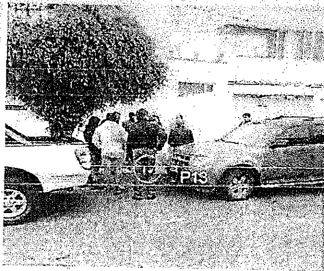
Figura 1 Ubicación Pítona 13

De acuerdo a los "Estudios Complementarios para el detalle de ingenierías de la Línea Roldós - Ofelia" realizados por la EPN-TECH EP, la ubicación de la Pítona 13 obedece a la información entregada en los Estudios de Pre factibilidad y Factibilidad del Proyecto Quitocables, y particularmente el "Estudio preliminar para la implementación de tres líneas de transporte por cable en barrios altos del Distrito Metropolitano de Quito" desarrollado por Noel Blandón DCSA INGENIERUR CONSEIL, y optimizada por la EPN-TECH EP para disminuir las afectaciones a sus alrededores.