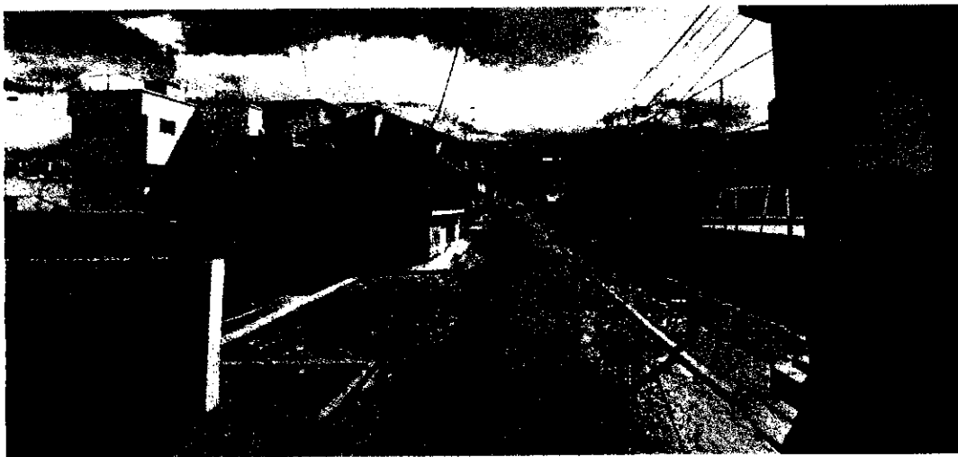
Fotografía 1. Ubicación de canchas del sector