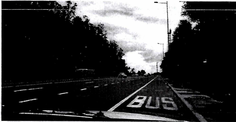
Foto 1.- Av. Simón Bolívar - Sentido Sur-Norte