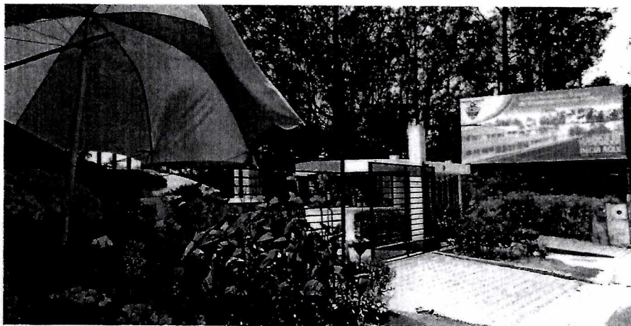
Foto 2.- Acceso al Instituto Tecnológico de Fútbol de Quito