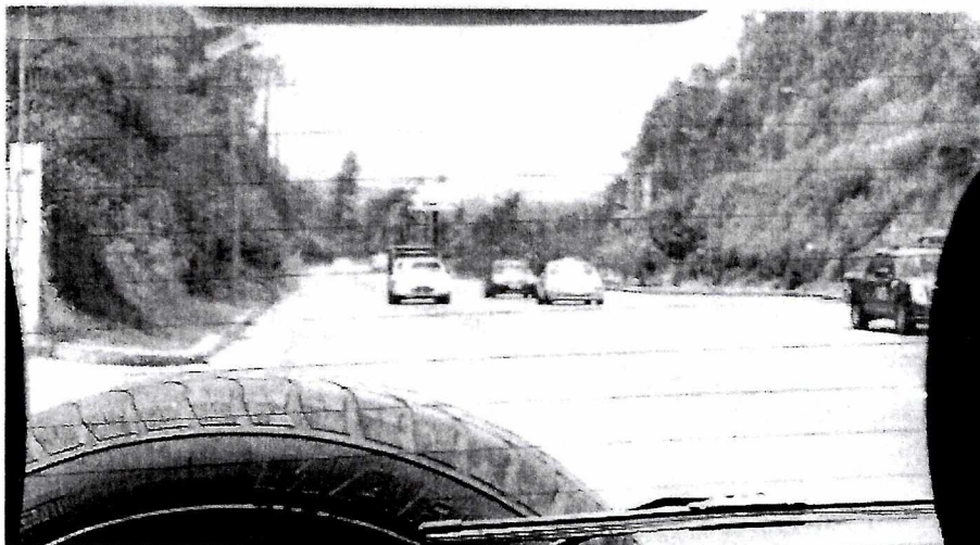
Foto 3.- Av. Simón Bolívar - Sentido Norte-Sur