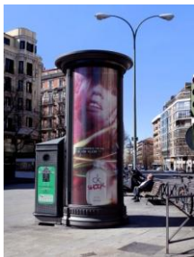
Columnas de Publicidad (ejemplo)