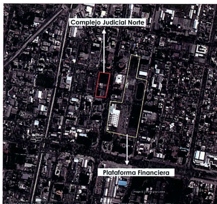
Gráfico No.1 Ubicación del Proyecto Urbano-Arquitectónico Complejo Judicial Quito Norte

El proyecto denominado Complejo Judicial Quito Norte comprende un lote con una superficie de 8.814,60 m 2 ; su geometría es rectangular y presenta una topografía plana. Siendo su función actual la de parqueaderos públicos.