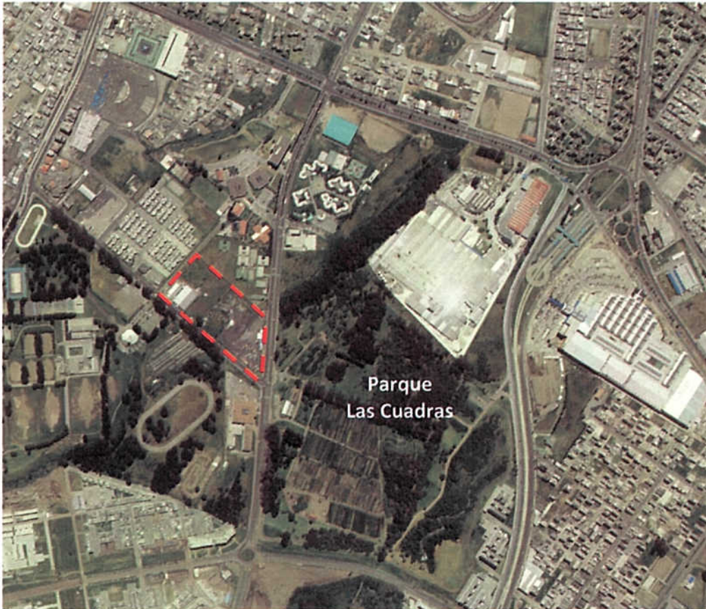
Gráfico No.1 Ubicación del Proyecto Urbano-Arquitectónico Complejo Judicial Quito Sur

es trapezoidal y se encuentra atravesado por una quebrada rellena que será destinada a espacio público.