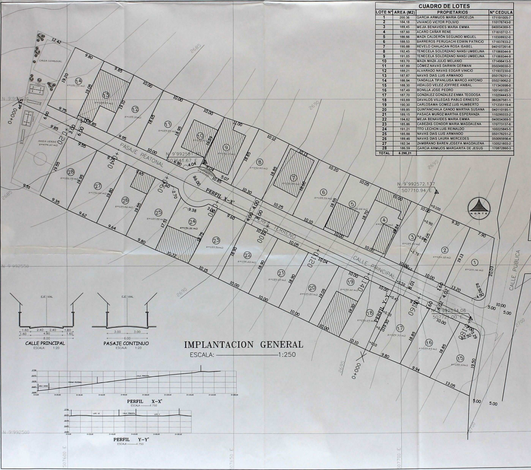
IMPLANTACION GENERAL ESCALA: 1:250