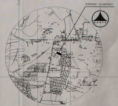
UBICACION ESCALA: 1:25000