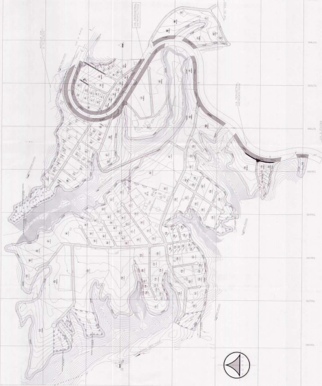
PLANO "TOPOGRAFICO" Escala: 1:500