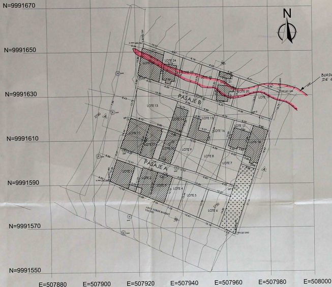
CUADRO DE AREAS