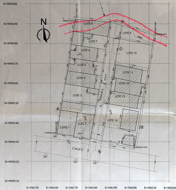
LEVANTAMIENTO TOPOGRAFICO Esc 1:250