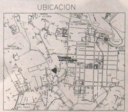
ESCALA H:1:10.000 CUADRO DE LINDEROS