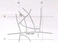
ESCALA UBICACION 1:25000