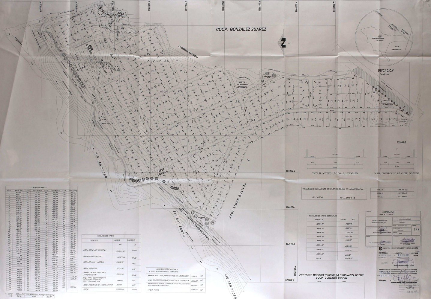
CUADRO DE AREAS