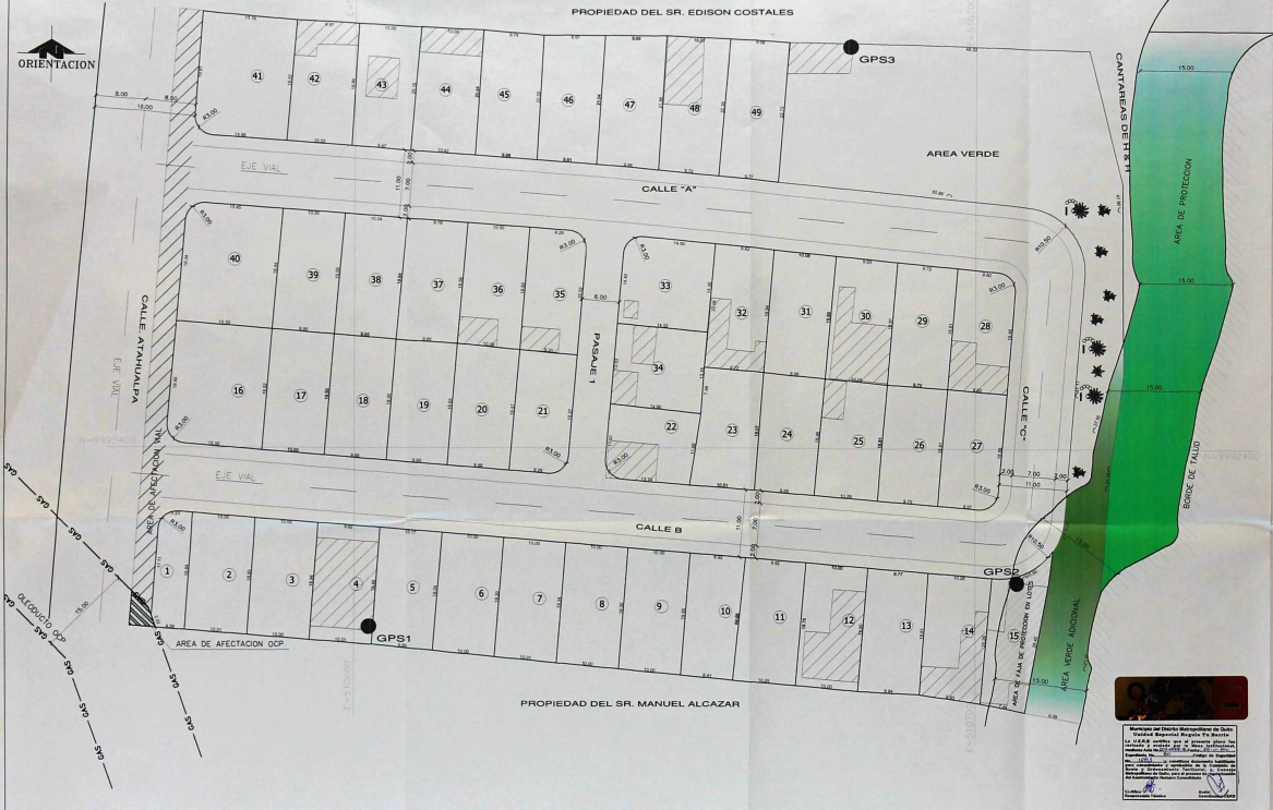
IMPLANTACION GENERAL TOPOGRAFICA ESCALA: 1 : 300