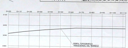
CORTE PERFIL TRANSVERSAL B - B' ESCALA H 1:500 ESCALA V 1:200