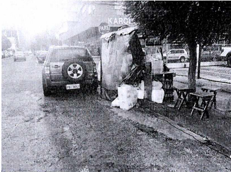
AFECTACION DE ZONA AZUL CON OBSTACULOS