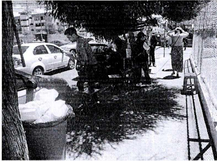
OCUPACION DE ESPACIO PUBLICO CON TABURETES