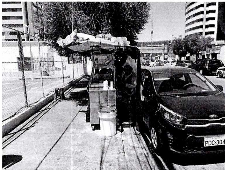
ATENCIÓN DE PUESTO POR PARTE DE OTRA PERSONA