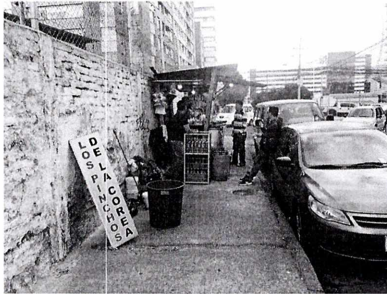
AFECTACION A LA MOVILIDAD DEL PEATON

2.2.- Esquina nor oriental de las calles Corea y Núñez de Vela, existe un puesto de choclo mote fritada, cuya propietaria ha ingresado el requerimiento de Permiso Único de Espacio Público para Comercio Autónomo, el 15 de enero del 2018, a través del trámite 2018-PUCA-AZNOR-0123, el mismo que no ha recibido atención favorable de parte de esta Administración Zonal, debido a los siguientes problemas: