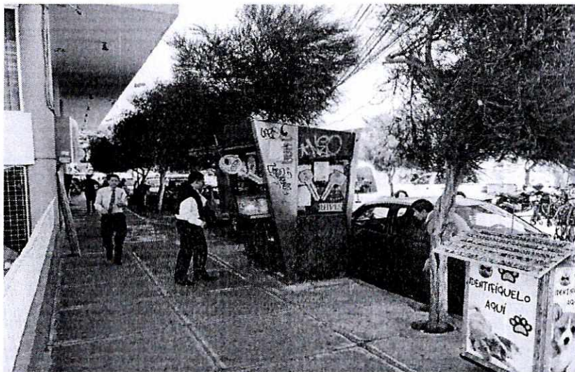
KIOSCO UBICADO CONFORME A NORMAS

solicitado la renovación del permiso para el año 2018, a través del trámite 2018-PUCA-AZNOR-0228 de 24 de enero del 2018. Al respecto debo informar que, a pesar de que el kiosco se halla instalado conforme a normas, el propietario no cumple con el pago de regalía, por lo que se halla pendiente la emisión del permiso para el año 2018.