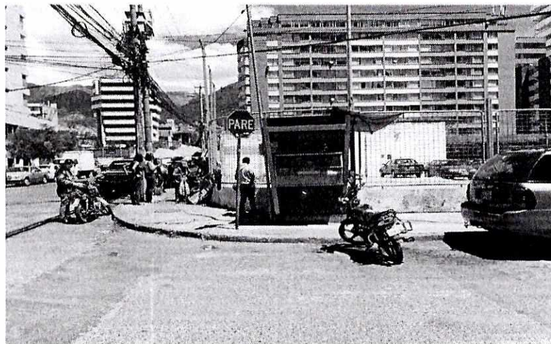
KIOSCO UBICADO INDEBIDAMENTE EN AREA DE ESQUINA

2.4.- Luego de ser reubicado por hallarse indebidamente instalado, en la esquina nor oriental de las calle Corea y Juan González, existe un kiosco de 1,68 m2 de superficie, de copiado de llaves y arreglo de cerraduras, que tiene el permiso PUCA: AZEE-1-239-2017, que estuvo vigente hasta el 31 de diciembre del 2017, para el que se ha