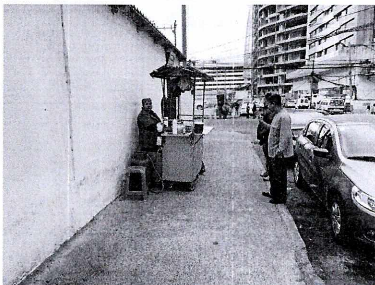
PUESTO CON PERMISO PUCA: AZEECAF-0081-2018

2.5.- En la esquina sur occidental de las calles Corea y Juan González, existe un puesto de venta de café con empanadas, el mismo que, por cumplir con los requisitos y reglas técnicas, cuenta con el permiso PUCA: AZEE-CAF-0081-2018, vigente hasta el 31 de diciembre del 2018.