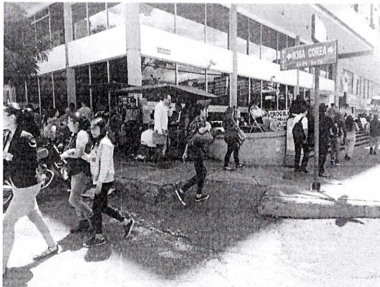
PUESTO DE LIMPIEZA DE CALZADO, UBICADO INDEBIDAMENTE EN AREA DE ESQUINA