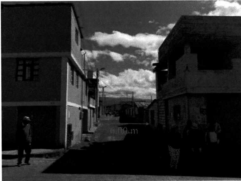
Tramo Inicial Calle "C"