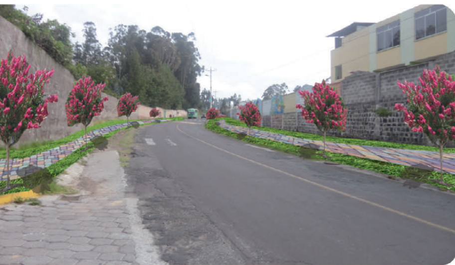
Fig. 5 Ilustración fotográfica levantada por el grupo juvenil JMAC (Jóvenes Mercedarios Activos para la Comunidad) de La Merced

Adicionalmente la comunidad rural al ser cernada al Ilaló, demanda de una regulación fuerte en el Uso de Suelo que favorezca el crecimiento ordenado y con Carácter Rural propiamente. Es decir un ORDENAMIENTO TERRITORIAL RURAL sobre todo alrededor del Ilaló, por ende alrededor del Anillo Vial propuesto.