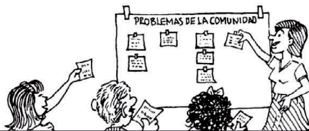
Fig. 1 Ilustración sobre la metodología aplicada en el I Taller de la Mancomunidad Ilaló, trabajado en 4 mesas

Entonces la verdadera participación ciudadana antes y después del levantamiento de información es necesaria, esto debe sumarse a los Planes de Desarrollo levantados en cada parroquia y de esta forma incidir en la generación y articulación de Políticas Públicas desde las bases del territorio. Por ello buscamos legitimar la gestión alrededor de los ejes que nos hemos planteado como mancomunidad y que en este I Taller buscamos retroalimentarlos con el aporte y debate de la comunidad que se beneficiará.