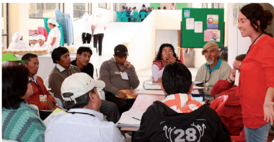
Fig. 2 Participación comunitaria MESA 4: Desarrollo integral de la Economía Popular Social y Solidaria en el I Taller de la MANCOMUNIDAD ILALÓ

Esto permitirá que la Mancomunidad cumpla sus objetivos articulados y sostenidos por su comunidad organizada – a través de los Comités Coordinadores o Consejos Mancomunados en primera instancia – dentro de un Reglamento Orgánico Funcional de la Mancomunidad Ilaló. Así articular nuestras propuestas de políticas públicas en una agenda política con los demás Gobiernos Seccionales (Sobre todo Municipio de Quito y Consejo Provincial) de acuerdo a las competencias establecida en el COOTAD.