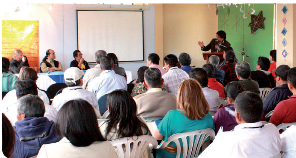
Fig. 6 La participación ciudadana de la Mancomunidad Ilaló legitima el ejercicio de la generación de Políticas Públicas desde los territorios dinámicos rurales, como el nuestro

Esto como una breve descripción de el proyecto de la Mancomunidad levantado con la finalidad de articular voluntades políticas en una Agenda que nos permita optimizar el talento humano de los Gobiernos Autónomos Descentralizados y su comunidad organizada que tenemos incidencia directa en estos Objetivos de los Territorios Dinámicos Rurales que conforman la Mancomunidad Ilaló.