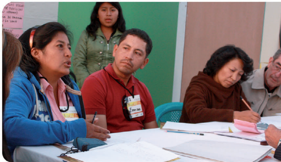
Fig. 5 En la MESA 3 de Plan de Turismo Sostenible los Actores de la Economía Popular Social y Solidaria debaten sobre las debilidades y fortalezas de la Zona en este eje

Estos dos ejes complementarios y que correrían por venas viales inteligentes se integran en dentro de una breve matriz o marco lógico levantado con el aporte de las Corporaciones INCLUIR y UTOPIA, favoreciendo su experiencia y organizando en una metodología que permita darle sostenibilidad y FORTALECIMIENTO DE LAS CAPACIDADES LOCALES para cumplir estos fines sociales que tiene fundamental identidad con dos aspectos: el primero la Conservación Ambiental en el Cerro Ilaló y sus territorios afines y el segundo la Inclusión de Género (femenino) como actores principales en el ejercicio de la Economía Popular Social y Solidaria. Cabe mencionar que con este proyecto y objetivos hemos presentado nuestra propuesta a la Convocatoria de la Unión Europea, para posible financiamiento.